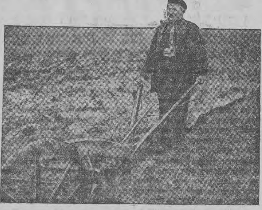
נאָכריכט פּערפּאָן אַ ברויכער פּאָן פּראַנצויזישען מל-כה-פרעזידענט, אין אַנאָומגעכער לאַנדווירטער