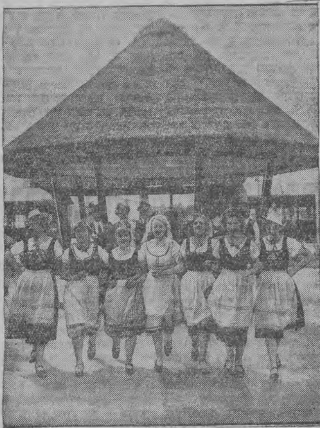
מירלעך אין פאלקסטר אט

נאָך משה'ס אוועקגעהן איז „ווייס“ צוריק פון זאָך, דאָס ערשטע וואָס עס האָט געטון איז גע- ווען זוכען משה'ן אָבער ער האָט איהם נישט גע- קאָנט געפינען, ווייל משה איז אַנטלאָפען אהיים „ווייס“ איז אַדורכגעגאַנגען אַ שטיק שטאט און פּו- האָט זיין פריינד נישט געפונען, אַל עמעשען וויל-כען ער האָט בעגעגענט האָבען מיט'ן פּוּט איהם געשטויסען. צוויי טעג האָט ער צוויי אַרגענבלאַג-דושעט ביז ער איז איינמאל אינדערפריה גע- קומען צו אַ פּערקאָדא. ער האָט נישט געוואוסט, וואָס עס איז אַווינט און ער איז צוריק איבערענגי-אָבער אַ היטער האָט מיר אַ שטעקען איהם צוריק-געטריבען „ווייס“ האָט געווען ווי אַ טאָ פּרויען געהען צוריק און געהען צוריק מיט גרויסע קוישען אינדעם איז צוריק אַ פּרויע מיט אַ פּולען קויש. לעבען „ווייס“ איז אַראָפּגעפאלען אַ שטיקעל פּלייש. דאָס קעצעלע האָט גענומען דאָס פּלייש און איז אַנטלאָפען. עס האָט געוואלט צוריערן די גאַס. אָבער עס האָט עס שוין נישט בעוויזען, ווייל אַנאָוטאַמאָביל האָט איהם איבערגעפּאָהרען.