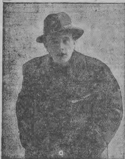
דער נאכט סאציאליסטישער דעפוטאט היינעס, וועלכער האט אויף א זיצונג פון רייכסטאג מפרווער לייך צושלאגען העם זשורנאליסט קלאָץ.

ער מיינט נאך אלץ, אז ער איז א שוואַך קראַנק מענשעל. דער חבר זייער אַבער טאָר איהם נישט אַבלאָוען און האַלטען אין אַיין דערמאָטיגען, ביז ער דערפיהלט אין זיך די קראַפט, הויבט אָן צו גלויבען אין זיך און הויבט אָן אַדער ער פערעג דיגט זיין אונטערנעמונג אָהן שום מורא.