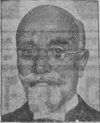
זאל ווערען פרעזידענט פון גריכענלאנד