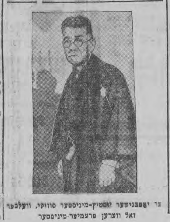
ער יאפאנישער יאטיק-מיניסטער סוזוקי, וועלכער זאל ווערען פרעמיער מיניסטער

אין יאפאן, אז ס'וועט געשאסען ווערען א איבער-פארטייאישע נאציאנאלע קאנצענטראציע. אז רעגירונג וואלס וואהרשיינליך בעקומען די אונטער-שטיצונג פון די מיליטערישע קרייזען.