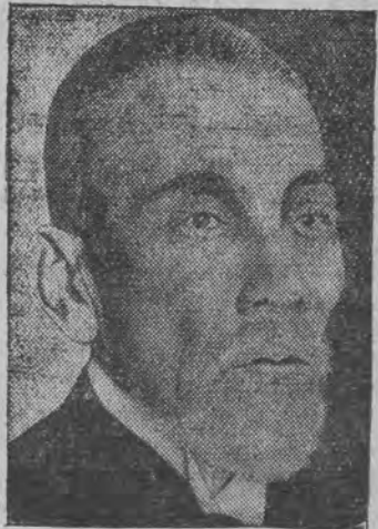
דער 77-יעריגער פרעמיער יאנואקי וועלכער איז דערשטער געווארען דורך עטליכע אפיצירען.

דאס קינד איז צופעליג דער'הרגעט געווארען ביי לינדבערג האט מעז אויסגענארט 50 טויזענד דאלאר