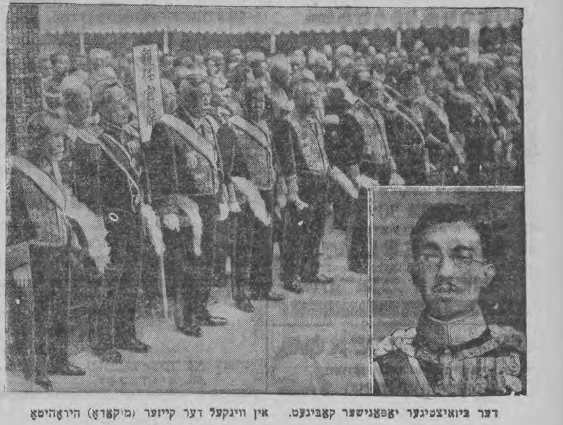
דער ביזאנטינער יאפאנישער קאבינעט. אין ווינקעל דער קייזער (מיקאדא) היראָהיטאָ

ירושלים, 18 (טי"א טעלעגראפיש). דער הויך-קאמיסאר האָט געגעבען דער יו-דישער „אנעק" ווייטע 100 סערטיפיקאטען צו די 2 טויזענד שוין געגעבענע. די נייע 100 סער-טיפיקאטען זענען בעשטימט פאר פרייע און קי-נדער פון ארץ-ישראל-בירגער.