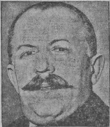
געז. פרעמיער בארטעל אויף וועלכען ענדערק שע סטודענטען האבען געמאכט אין לעמבערג ברוטאלען אָנפאל.