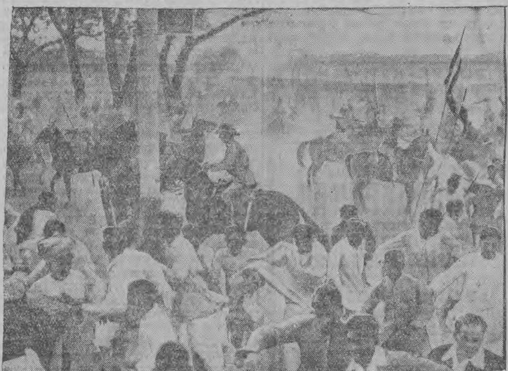
פארציי צומרייבט די סעמפענדע