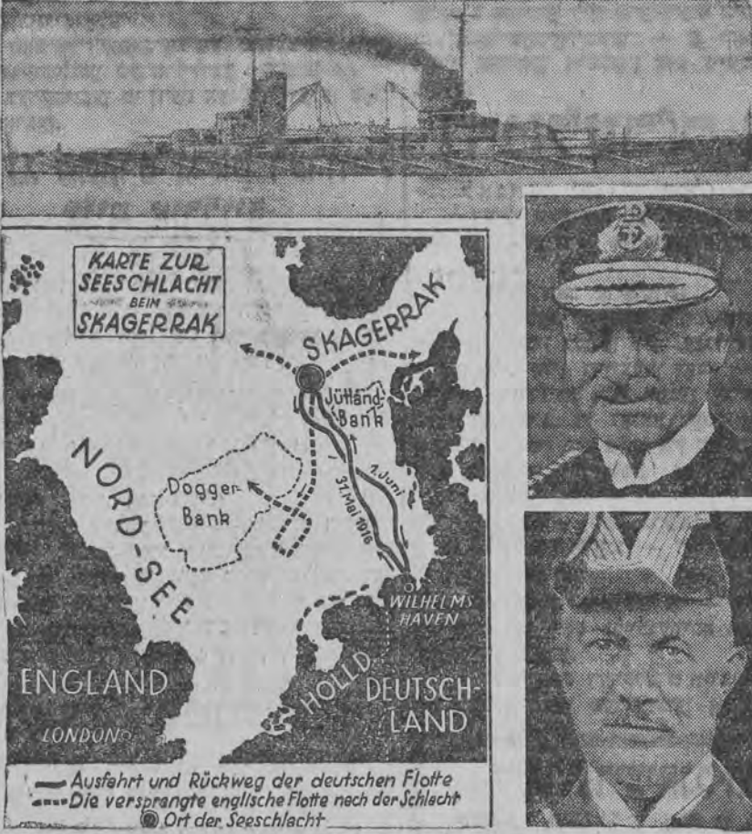
אויב עס: די שיק, פרידריך דער גרויסער אויף וועלכער עס האָט זיך געפּונען דער מיהרער פון דייטשען פּלאָט אדמיראַל שער (אונטער רעכטס). דער מיהרער פון ענגלישען פּלאָט אדמיראַל דושעליקאָ. לינקס: קארטע פון דער שלאכט.