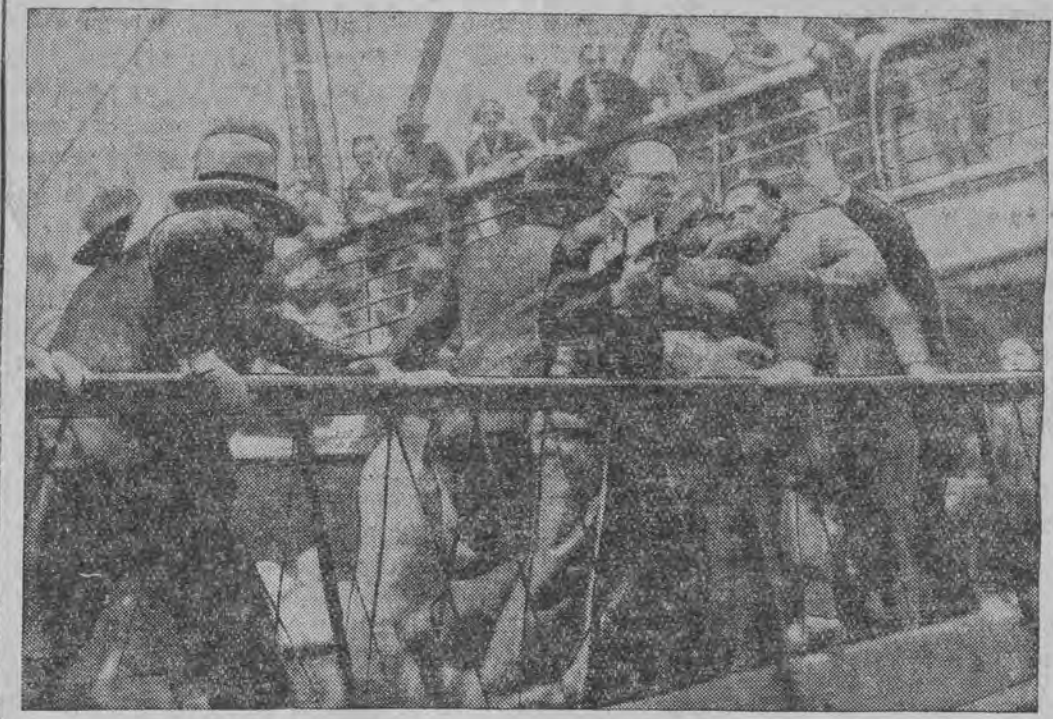
די געראמאנענישע פאסאזשירען פון דאמפער, ווארום פיליפאר ביים אנקומען אין האפען פון מארסער

בערלין, 30. (ספ. טעל.) ביי די נעכטיגע לאנדשאט-וואהלען אין אלדענבורג האבען די נאציאנאל-סאציאליסטישען בעקומען אנהייב אנטקעגן צו שטימען, דערגרייכענדיג צו 24 מאנדאטען אויף דער אלגמיינער צאהל - 46 פערלירען מאנדאטען האבען די סאציאליסטישען די קאמוניסטישען און דער צענטער.