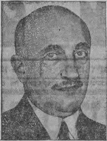
דער נייער גרויסער פרעמיער סאָנאַטאָווי.