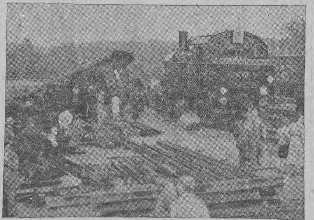
א בילד פון דער שווערער באָהן-קאָמפּאָסטראַפע ביי בענסהיים (רויטשלאַנד)

איהר זינט דורכגעפאָהרען אַ היבש ביטער פון סאָויעט-רוסלאַנד — זאָגט מען מיר אין מאָס-קווע — איהר זינט געווען אין די גרויסע אינדער-סטריעלע שטעט און אין די קליינע, פערזאָרפּענע שטעטלעך, אין אַלע היינטיגע צענטערס און אין גייע ווייטע קאָלאָניעס, אין אוקראַינע און אין ווייס-רוסלאַנד, אין די צענטראַלע פלעצער פון אומגעבן לאַנד און אין דער ווייטער קרים, — וואָס דעקט איהר וועגען אומ? — מיין מיינונג — בין אין קלאָר און אויפ-ריכטיג — איז, אַז עס געהט דאָ ביי איהר אָן אַ געוואָלדיג גרויסע אַרבייט, אַ ריזיגע אַרבייט, מען קאָן זאָגען אַ קאָלאָסאַלע מענשען, אמת, פערלירען דאָ ווייטע געוונד, ווייטע וואַלירן, ווייטע באַרמאַלען לעבען; מען צווינגט איהר זיי אַרויף זאָכען געגען ווייטע ווילען, אָבער עס וויינט אויס, אַז אַנדערש קאָן עס נישט זיין. אין אזא לאַנד ווי רוסלאַנד, ווייזט אויס, אַז מען מוז צווינגען מענשען, אין אַזא לאַנד ווי רוסלאַנד, אַז לאַנד פון הונדערט און זעכציג מיליאָן איינוואוינער, — איז, ווייזט אויס, צוואַנג אַלעמאַל געווען טיילווייז אַ גויס-ווענדיגקייט, און איצט אויך.