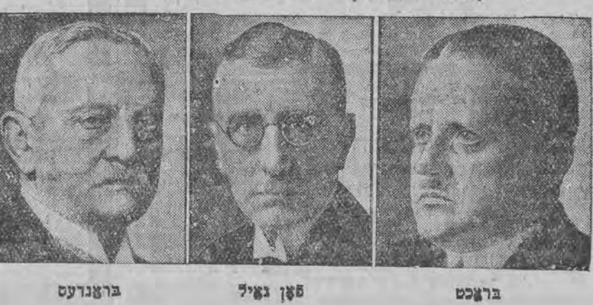
בראנדעט 5 גאיל בראנדעט

דאס געשפרעך מיט היטלערן האט דעפארענט די ערשטע איבערשאונג. היטלער האט ערקלערט אן די היטלעריסטען וועלען בארייגט אריינגעהן אין דער רעגירונג און וועלען נישט טאלערירען וועלכע ס'איז, מען עס אפילו זיין רעכטע רעגירונג, די היטלעריסטען פאררען פונאנדערצולאזען דעם פאר-לאמענט און צוריקקעהרען די פארלאמענטאריע בעציי האנגען, וועלכע וואלטען געווען אנאויסדרוק פון די היכטיגע שטימונגען צווישען דער בעפעלקערונג. צוליב דעם, וואס הינדענבורג וויל איצט נישט אדורכפירען קיין נייע וואהלען, האט די שטעלונג פון היטלערן אינגאנצען א סוף געמאכט צו הינדענבורגס פלענער.