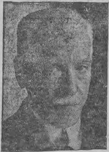
דער בערימטער קאָמפאָזיטאָר פּראָפּ. היינריך הערקנער, אין נעשטארבן אין עלטער פון 69 יאָר.

גערעכענטע און אַ גוט אָרגאַניזירטע אַ מלחמה אין איצטיגע צייטן איז אייגענטליך אַ שטעקען מיט צוויי עקען, קיינער קאָן נישט זאָגען, צי איהר וועט פערשפילען אָדער גאָר אויס פון איהר די ויגען. די לעצטע מלחמה האָט איהר געבראַכט צו דער הערשאַפט אין רוסלאַנד, און אַ נייע מלחמה איצט, ווען דער ברייטער עולם איז איבעראַל אַרבייטסלאָז און אומצופרידען, קאָן איהר ברענגען צו דער הערשאַפט אויך אין אַנדערע לענדער. אַ מלחמה וועט אָבער מוזען פאַרקומען, און צו אַ מלחמה מוזט איהר, פערשטעקט זיך, זיך גרייטען. זיך גרייטען צו אַ מלחמה, וואָס קיינער ווייסט נישט, ווען און פון וואָנען זי וועט אויסברעכען, הייסט זיין שטענדיג און אַ נערוועזען צושטאַנד, אין דעם דאָזיגען נערוועזען צושטאַנד געפינט איהר זיך איצט, אין דעם סאַמע ברען פון אייער בור-אַרבייט. איהר בויט, און איהר האָט מורא פאַר אַ מלחמה פון אַלע צייטן. איהר לעבט אין אַ שטענדיגן דיגען צושטאַנד פון מורא.