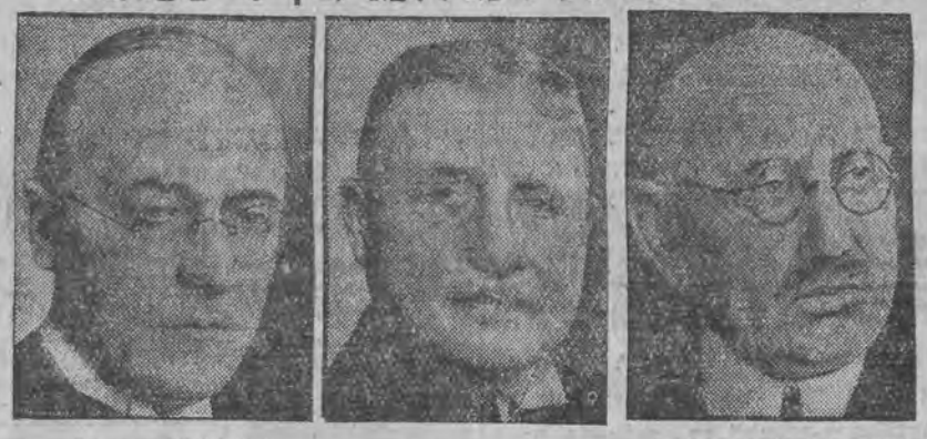
קאנצלער ברינינג (איינער און קריגס-ענינים) גרענער שטענערוואלד ארבייט