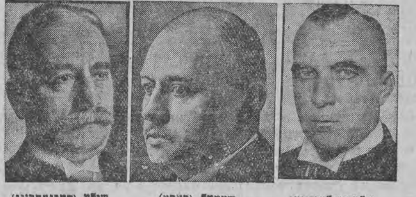
שלאנע-צענינגען (קאמיסאר 5 אר אסט-הילף) שטעצל (פאסט) שילע (דערנעהרונג)