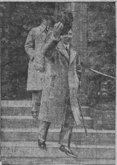
דער נייער רייכספאליצער פאפער פער- לאזט דעם רייכסטאג.