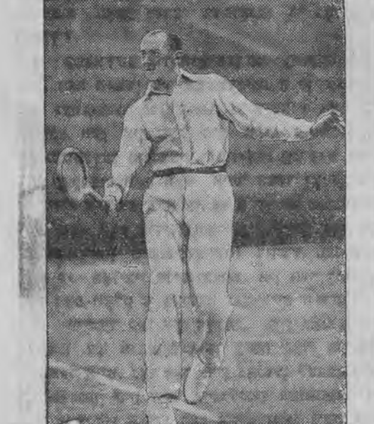
האָט געזיגט אין אינטערנאַציאָנאַלען סעניס-טורניר אין פאַריי.