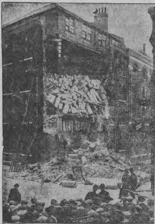
א גרויס לאגער-הויז אין לאנדאן איז איינגעפאלן אויף א רעטזעלהאפטען אופן.