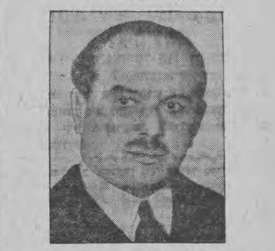
קארלאס דאָוילא, דער מיהרער פון די רעוואלוציאָנערען