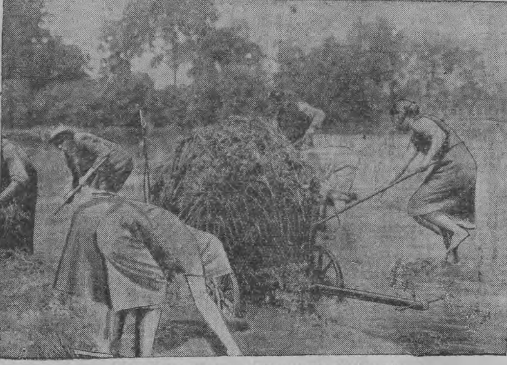
מ'עמיהט זיך צו ראטעווען דעם היי-שניט