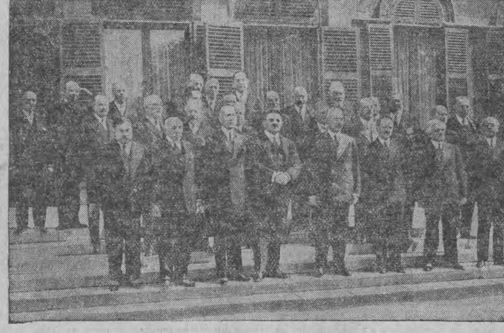
רער 4 טער פון לינקס (1-טע רייה) פרעמיער העריא

פאַר יו, 7 (טעל.) אויף דער בעכטיגער פייערליכער זיצונג אין פאַרלאַמענט האָט דער נייער פרעמיער העריא געלייענט אַ העקלאַראַציע פון דער נייער רעגירונג. זיין רעדע איז אַפט איבערגעריסען געוואָרען דורך שטורמישע אַפלאָרטיממעטען.