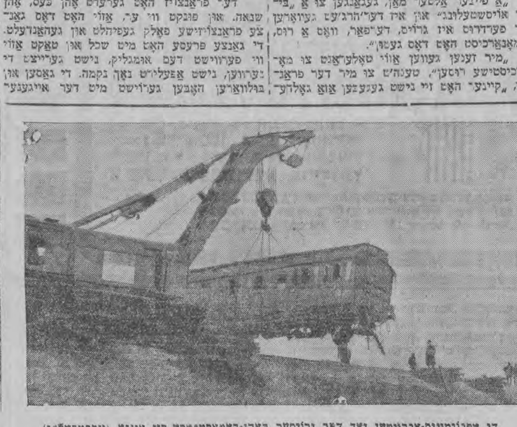
די אַפּווימאָנט-אַרבייטען נאָך דער גרויסער פּאַן-קאָסטאַרע ביי אַנאַ (וועסטפּאַלץ)