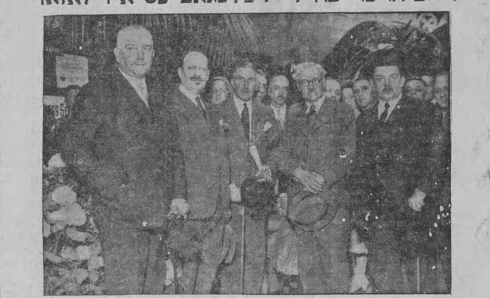
פון לינקס: דייטשער אויסערן-מיניסטער פאן ניראט, מאסקאני (איטאליען), קאנצלער פאן פאפען, מאקראנאלד (פנגלאנד) אין העריץ (פראנקרייך).

פאר גאלד, ביזשונטעריע אין לאמבארד-הוויטעם צעהלט די העכסטע פרייען איזיראר פיאלקא, פיעטריקאווער 7