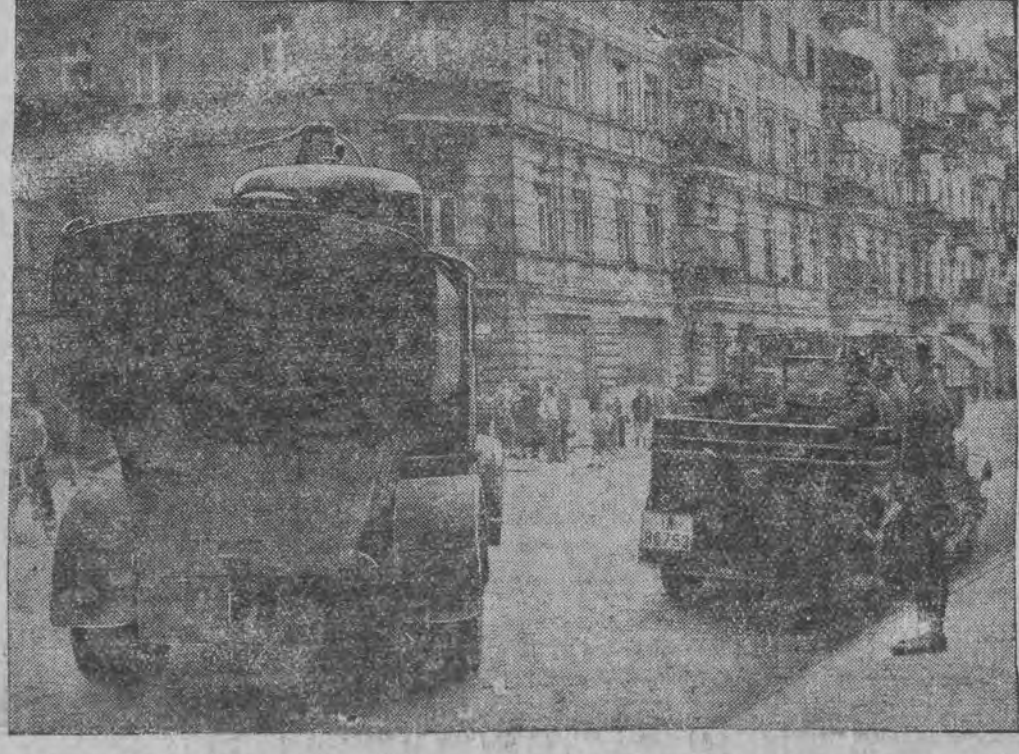
לינס: אן'אויטא צו בעגיסען די דעמאנטראקטען מיט וואסער, רעכטס — אן'אויטא מיט פאליציי.