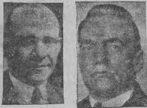
רעכטס: פיק, דער מיהרער פון דער קאמוניסטישער פראקציע אין וויסלא. לינקס: טעלמאן, דער מיהרער פון דער פארטיי.

צו די בלוטיגע אונרוהען אין מאאביט—בערלין