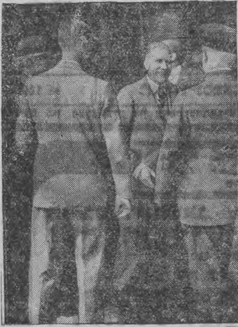
אין צוריקצוקומען קיין בערלין פון לאזאן אויף א קורצע צייט.