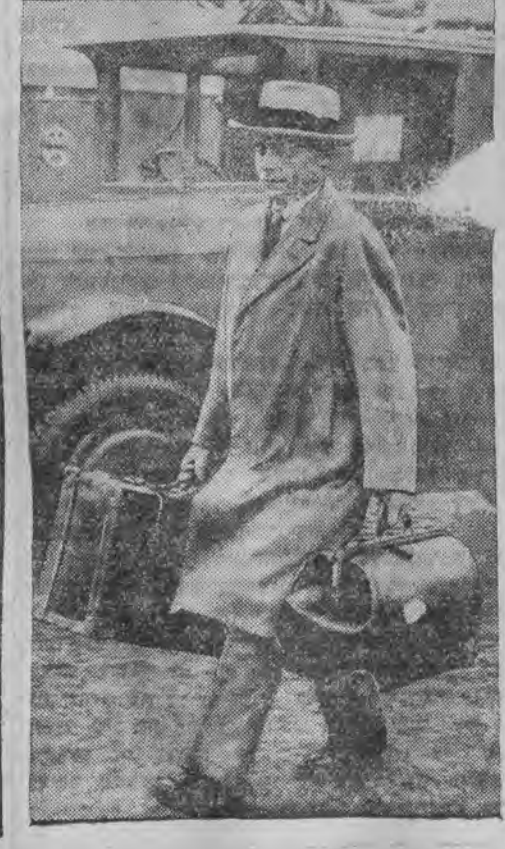
דער דאזיגער מעש קומט פאר דעם קומענדיגען זונטאג

פאווא נורמי אויפ'ן וועג קיין לאס-אנגעלעס