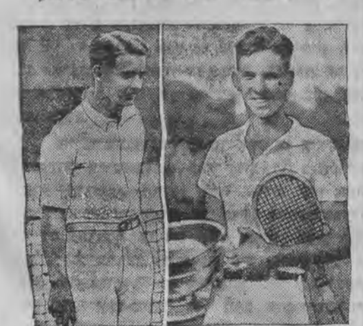
דער ענדענדר אויסטון און אמעריקאנער בינעס

אינטערנאציאנאלער מעש פוירען - שוועדען הומט פאר זונטאג אין ווארשא