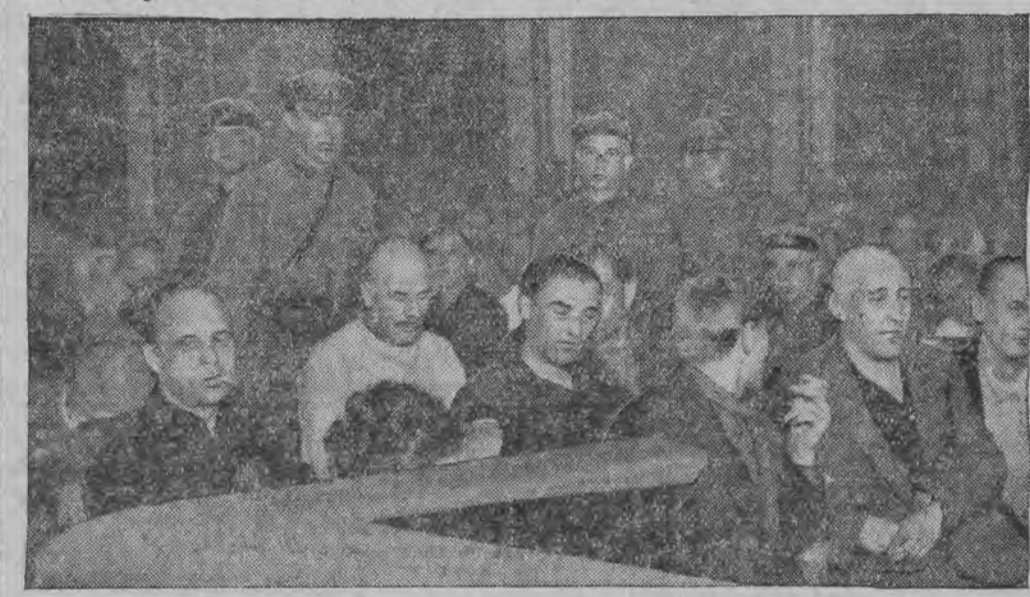
פינף פון די אָנגעקלאַגטע זענען פּערשטעט געוואָרען צום טויט, די איבריגע אויף 150 יאהר טורמע צוואַמען