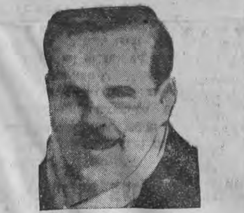
גענו. פארטוגאלישער סעניא עפאנוועל II