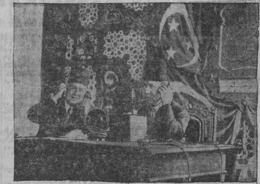
עגיפטישער פרעמיער מיהרט דאָס ערשטע געשמוצן מיט'ן ענגלישען לאָרד-קאָנצלער.

פאן נאלד, ביזשומערע אין לאַמבאַרד-הויזעם צעהלט די העכסטע פרייזען איזירדאר פּיאָלקאַ, פּיעטריקאווער 7