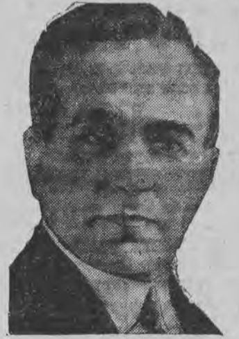
דער בראזיליאנער פרעזידענט געטוליא ווארנאם

לאַנדאָן, 13. (ספ. טעל.) דער אויפשטאנד אין בראזיליען, וואס איז אויסגעבראָכען אין דעם שטאט סאָ-פאָלאָ פער-טרייטערט זיך אין א שנעלען טעמפא.