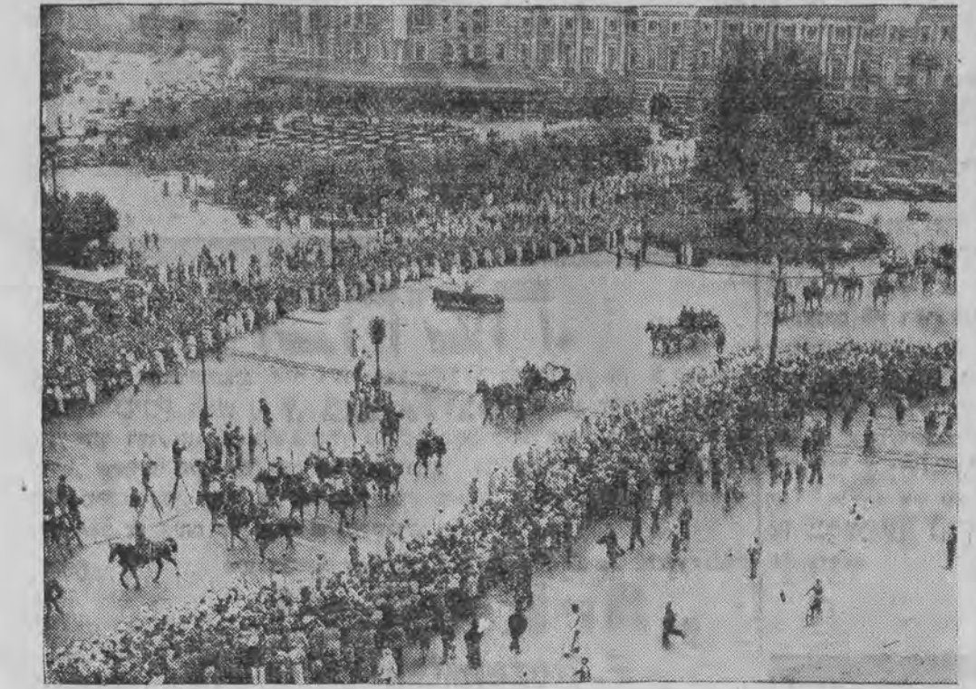
וועלכע האבען געקעמפט אין שאנכאי און מאנדזשוריען