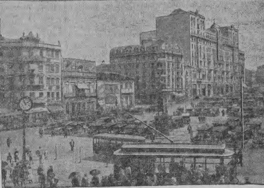
די זיי-בראזיליאנישע האפען-שטאט סאנטאם

וויאָ דע זשאַנעיר, 16 (סעל.) צווישען רעגירונגס-מיליטער און די אויט-געבונטעוועטע איז נישט געקומען צו אַ צוזאַמען-שטויס, די רעוואָלוציאָנערען וואַרפֿען פון אַרע-אָ-ווישען ביי דעם צווייטן טאָג.