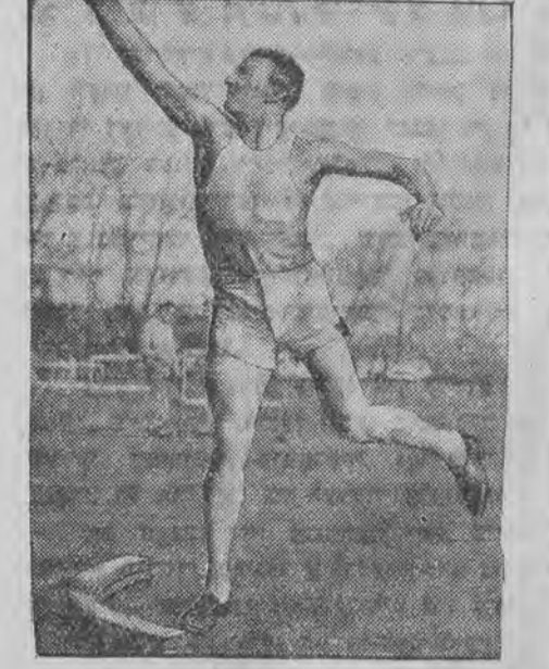
האַט געשלאָגען דעם וועלט-רעקאָרד אין קייל-וואַרפּען