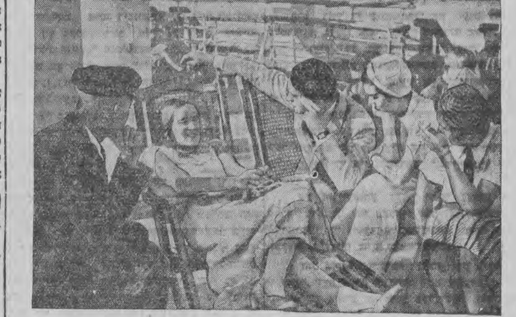
אַ גרופּע אַנטיילנעהמער אין דער אַלימפּיאַדע אויף דער שיף