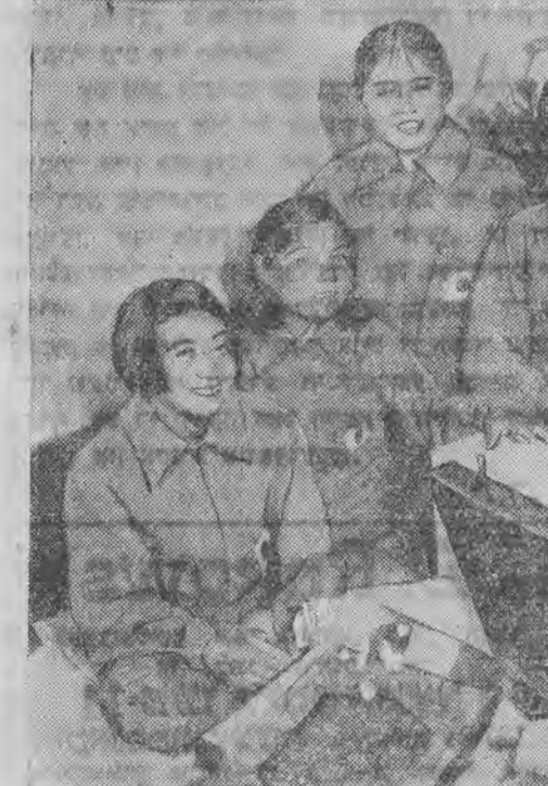
נעהמען אַנטייל אין דער אַלימפּיאַדע