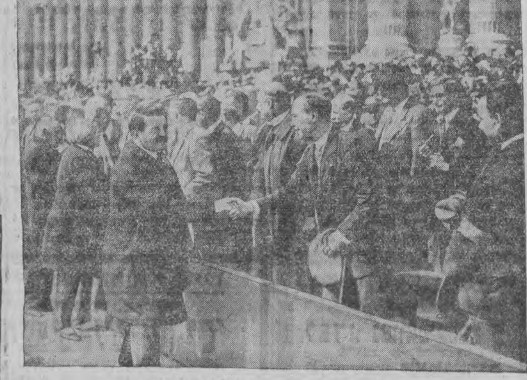
הערויא בעגריסט די עהרען-נעסט