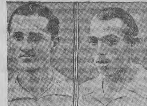
די אַטאַליענישע טעניס-מייסטער סערטראַהאַ און פּאַלמער וועלען שפּילען מיט די דייטשען וועגען די ווייט-בעכער.

נעכטען האָט דער לאַנדער מאַטאַציקליסטען קלוב איינגעטרעטן אַ גרויסע אַמפרעזע צוואַמען מיט דער ליגע פאַר לויסט-פּערטיידיגונג און אַנטי-גאַל-ליגע. אין דער אַמפרעזע האָבען אַנטהילגענו-מען 35 מאַטאַציקליסטען, וועלכע האָבען אדורכגע-מאַכט אַ שטח פון 250 קילאָמעטער. אַ טייל וועג האָט געמוזט אדורכנעמאכט ווערען אין גאָר מאַסקעס, ווייל דער וועג איז געווען פּערנעפעלט מיט גאָר.