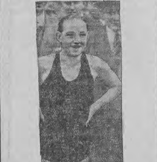
האַט געשלאָגען אַ גייעס סוויצן-שוויי-רעקאָרד