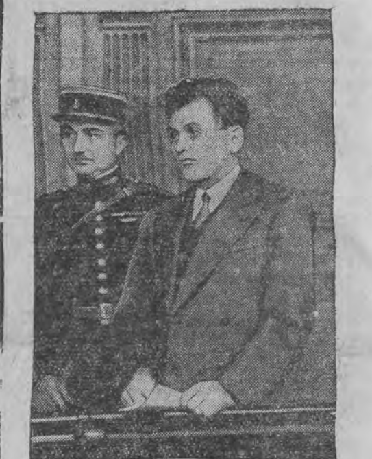
פאר'ן פראנצויזישען געריכט