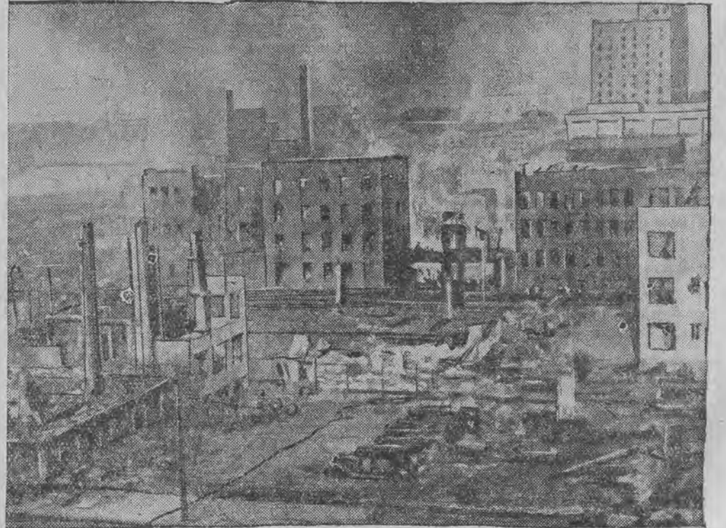
האט צושטערט רויזנע לוקסום-אינארדונגען