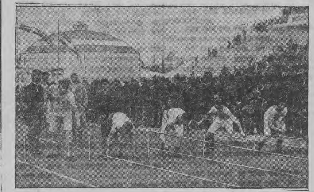
בעת דער ערשטער אלימפיאדע אין אמהען אין יאהר 1896