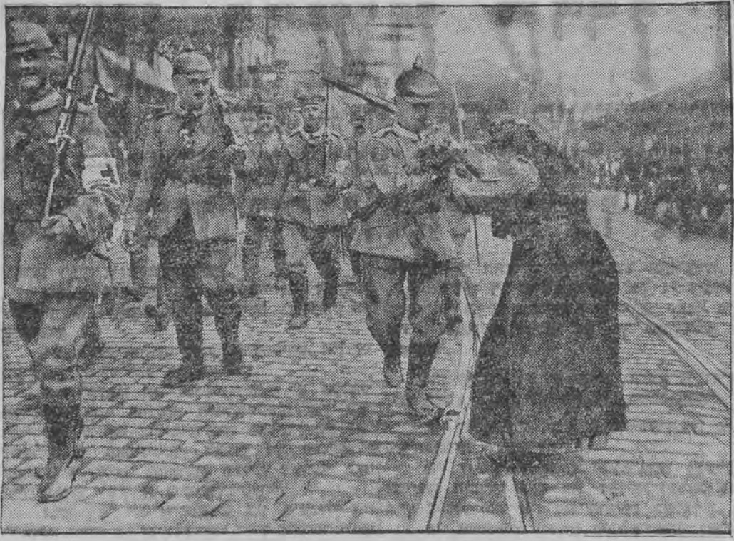
די ערשטע מאביליזירטע דייטשע זעלנער

מיט 18 יאהר צוריק האט זיך אנגעהויבען דער וועלט-הריג