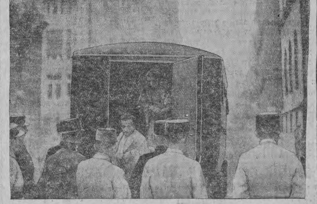
די אונגארישע קאמוניסטען ווערען אינטער א שטארקער וואך געברענגט אין שטאנד-געריכט.