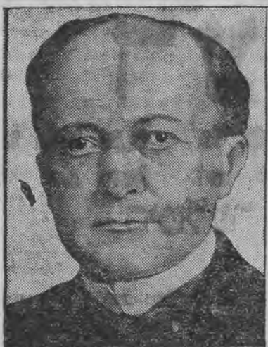
אין בעשטימט געווארען אלס פארויזער פון א מיטע, וואס דארף אין ארדנונג ברענגען די צמערין קאפיטאליסטען.

ירושלים, 1 (יט"א טעלעגראפיש) ס'איז קאמיטאד וויקאם, אין פארהאן א נייע קאפיטאליסטישע פערזענליכע געווארען דאס נייע עמיגראַציע-קאפיטאליסטישע, וואס וועלען דארפן געזעץ, וואו ס'זענען פארמולירט א גאנצע רייע עמי-אויפווייזן נאך 500 פונט, אנטשטאט וואס מין גראציע-פארשיפטען. פון דעם נייעם געזעץ, וואס איזט האבען קאפיטאליסטען געמוזט אויפווייזן און ארויסגעגעבן געווארען אין הסכם מיטן היידן טויזענד פונט.