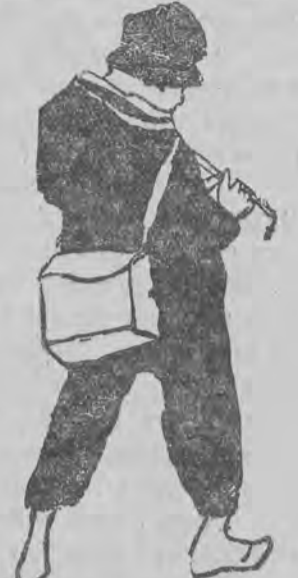
דער פוילער שילער, וואס פער-גנבעט זיך פון שול... געצייכעט פון בערעל דאָרען.

איינער א בעל-בילה האט געהאט צום אקערען אן אקס מיט אן אייזער. איז אבער דאס אייזער געווען, לא עלינו א לעמ"שקע — אלט און אייטגעזעצט, געהט צוויי טריט און צום דריטען פאלט ער אנהער. איז איהם דאס אייזער פערמאנסט געווארען — האט ער אויף איהם געבעטען דעם טויט. טאג אויף טאג האט ער די הענד אין א תפילה צו גאט געשפרייט: — גאט דו גוטער, נעהם צו פון מיר דאס אייזער. — גאט דו דערבארעמדיגער, הער צו מיין תפילה נעהם איהם צו און בעררי מיר! איינמאל שטעהט ער אויף איינזעפליה, ווי זיין שטייגער איז, ראשית-הכמה געהט ער אין שטאל אריין צושייטען אביסל עסען דעם אקס מיט דעם אייזער, און זיך צוגרייטען אין פעלד אריין. די זייער-זייט איז געשטאנען אין פולען ברען. אריינגעגאנגען אין שטאל, הערענעט ער דעם אקס ליגען דעם קאפ פערווארפען, די פיס צע-שפרייט, און דער אייזער שטעהט א געוונטער, א שטארקער און קייט די שיריים פון דעם אקס. איז ער שטארק ביז געווארען, האט געוואר-פען, וואס ער האט געהאלטען אין האנד און האט ער זאל צוועקענעמען דעם אקס. טרעפט ער א טאטער שטעהן אין גאס און ווארט אויף ארייט, זאג ער איהם: — היי, דו טאטער, קום מיט מיר, וועסטו צו-רעכט מאכען אן אייזער, וואס איז ביי מיר גע-פגרט די נאכט. איז איהם דער טאטער נאכגעגאנגען ביז דער שטוב. געקומען אין הויף, אריין אין שטאל, הער-זעהען דעם אקס, פרגעט דער טאטער פערוואר-פערט. — דער אקס איז דאך געפגרט, נישט דאס אריינגעגאנגען אין שטאל, הערענעט ער דעם אקס מיט אן אייזער.