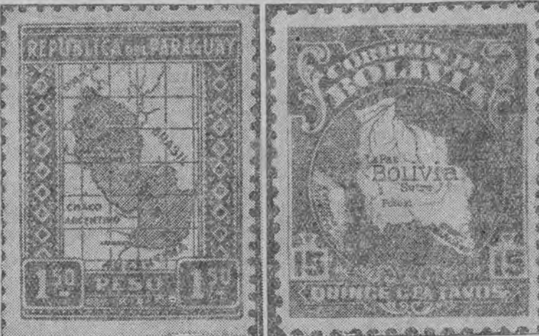
די ברייטמאַרקען, צוליב וועלכע ס'איז אויסגעבראָכען דער קריג צווישען פּאַראַגוואַי און באַלייזשן (פּאַראַגוואַי האָט אויף איהר בריף מאַרקען געצייכענט אַ מאַפע מיט'ן גאַנצען גרעניץ-געביט שטאַק, וואָס געהערט צו בידע מלוכות).