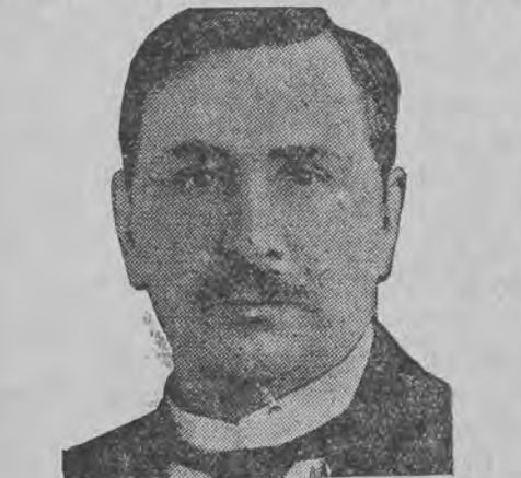
האט זיך אנגעגעבען אין דימיסיע

לייטענאנט 8 (פ.ט.ט.) ערשט היינט קומען אן פרטים פון דער שבת