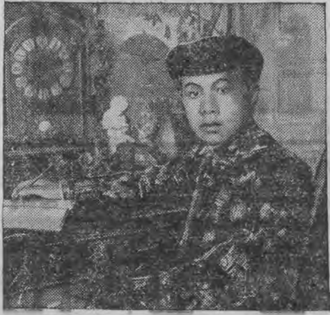
קעניג פון פאנאס בעא דאז האט ביו איצט סטודירט אין פאריז, איצט פארהרט ער איבערנעמען די מאכט.

צוליב די לעצטע גרויסע רעזענס האט די ווייסעל אויסגעגאסען אין ביעדסקער פאריאט. דאס וואסער האט אפגעשווענקט די נאנצע תבואה וואס איז נאך נישט געווען אראפגערוימט פון די פעלדער, אין וואסער האט דאס וואסער פערנא-