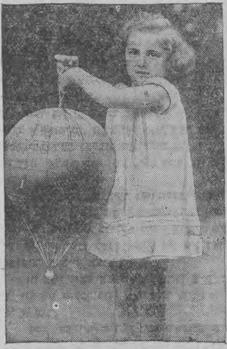
דאָס מעכטערע פון פראַם. פיקאר, וועלכער פערנעהמט זיך ווידער צו פליהען אין דער סטראַטאָספערע.