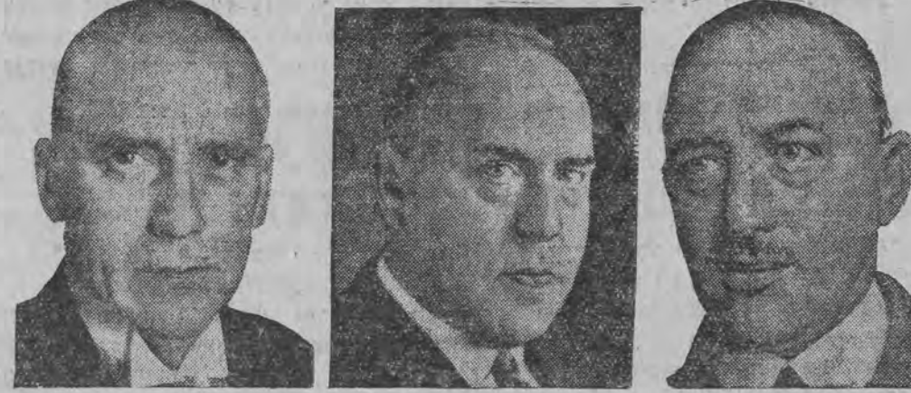
פריס שטראפער הירל די קאנדידאטען:

אין וואהר, הינטער קעלן, האָט מען אויך געפונען עטליכע הונדערט רעוואָלוציערע, אַ גרויסע צאָהל אמאָניציע אין האַנד-גראַנאַטען, דאָס געוועהר איז אַריינגעשמוגעלט געוואָרען פון בעלגיען, אין דייטש-שלעזישן זענען נעכטען ווידער פאַרבעקומען אַ רייה סעראָ-קאַסען, ארום האַלבע נאַכט האָט אין דיטמערסקאָן אויפגעריסען געוואָרען אַ באַמבע הינטער דער טיר פון דער היטלע-רישער בוכהאַנדלונג, די בוכהאַנדלונג איז פערניכט טעם געוואָרען. אין בראַונשבערג איז שווער פערוואַנדעט געוואָרען מיט מעסערס און רעוואָלוציערע דער היטלעריסט געלשע. אין דרעזנבורג איז דעמאָלירט געוואָרען דאָס יודישע געשעפט פון ווייבערג. אין רייכענבאָך האָט מען געוואָרפֿען אַ באַמבע אויפן דעראַקטאָר פון סאָציאַליסטישן פּיאָר-לעטאָריע פּעשע, דער גרענאַט האָט אַבער אויסגעריסען אין דער האַנד פון דעם וואָרפֿער יענען און ער איז דערהאַר'ט געוואָרען. בערלין, 9 (ספ. טעל.) פון קאָמף וואָס ווערט געמיהרט אין ענין פון דער רעקאָנסטרוקציע פון דייטשען קאָבינעט, איז צו זעהען, אז די נאַציאָנאַל-סאָציאַליסטישען זענען צוטיילט אויף צוויי גרופען, איינע מיט היטלער'ן