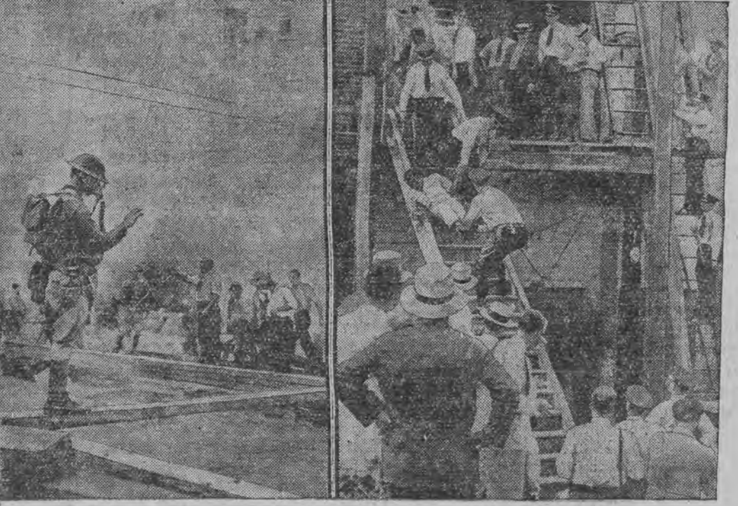
מ'טרייבט די וועטראנען פון די הייזער גאָ-קאָנריק פון דער פּאָליציי