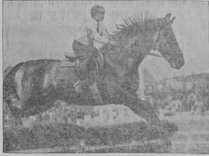
פערד-געיעג פון יונגעליכע איז איצט פאַרגעקומען אין בערלין.