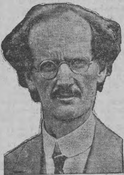
צו זיין גייעם מליה אין דער סטראטאטעטערע.

אין ווארשא איז פארגעקומען דער אלפוי לישער פייערלעכער-צוזאמענפאך, פערבונדען מיט גרויסע פייערונגען. אין טשעכאסלאווא איז געפיערט געווארען דער 500-טער יאהרטאג פונם טשעכאסלאוואער קלויסטער. אין דער דאזיגער פייערונג האט זיך בעטייליגט א ריוויגער עולם פון אנ'ערך 200,000 צו דער פייערליכקייט אין געקומען דער מלוכה פרעזידענט.