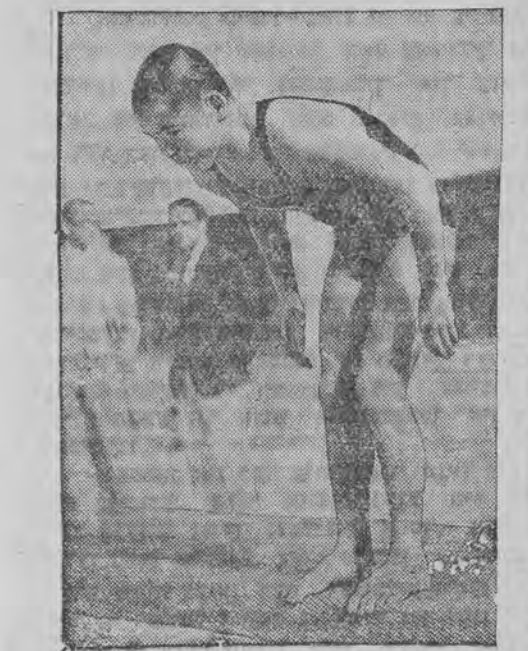
14-יעהריגער שווימער יאָפּאַנער קיטאַמוראָ האָט זיך דער אַלימפּיאַדע געווינען ממש וואַונדער.

דער בעריהמטער פּוילישער לויפער, אלימפ-יאדע-מייסטער אין 10 קיליאָמעטער-לויף צוזאַמען מיט דער גאנצער פּוילישער לייכטאַטלעטישער עקס פּעדיציע וועט זיך פּערמעטען אין טשיהאגא מיט די לייכטאַטלעטישע מאנשאַפטען פון אנדערע 20 לענדער, וואָס פּאַהרען צו דעם צוועק אַפּ פון דעם אַנזשעלעס קיין טשיהאגא.