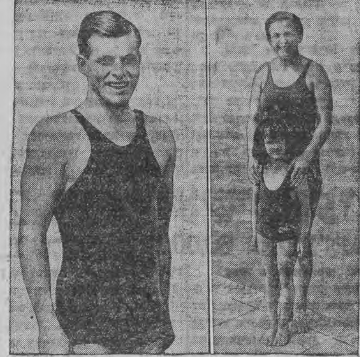
דו שאַרדזשא סאַלעמאַן זיגערין אין קינסט-שפּרינגען טראַבע זיגער אין 400-מעטער-לויף

מכבי (לאָדז) - סקאַדאַ (וואַרשאַ) 2:4 (0:1) „סקאַדאַ“ איז דער פּרעטענדענט אויף מייס-טער אין „א.קלאַס“, דעריבער איז געווען א גרויסער אויפטו פון דעם מייסטער אין דער לאָדזער גרופּע פון „צע“-קלאַס אַרעפּזיבערעגען „סקאַדאַ“ קיין לאָדז, ברי זיך צו איבערצייגען אין דער ניווא פון דער וואַרשעווער „א.קלאַס“. די וואַרשעווער געסט האָבען זיך נישט רעפּרעזענטירט פון דער בעסטער זייט און דערווי-זען, אז דער וואַרשעווער מיסבאַל-ספּאַרט קאָן נאָך נישט דערגרייכען דעם לאָדזער „א.קלאַס“. „מכבי“ דאַרענען האָט געהאַט איהר גוטען טאָג דערווייזענדיג, אז זי האָט פּערדינט צוצוגעהען צום פינאַל וועגען אַריבערנעהן אין „א.קלאַס“ די