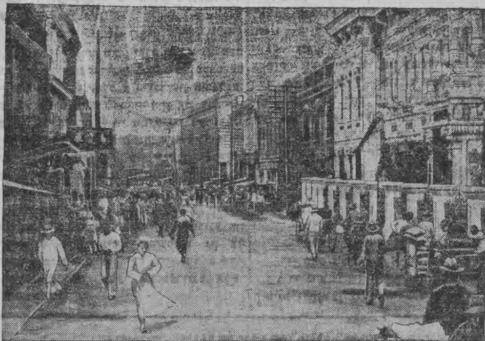
א נאם אין כארביין

באמאנן לעמיר אנהויבען פון בעריהמטען רוסישען רעוואלוציאנער מיכאיל בוקשין, (געשטארבען 1876) דער ווען פון א רייכען גוט-געוועזענער, האט ער וויי-טער געקענט פיהרען דעם וועגען לעבען פון א זאטען מענטש. ער האט אבער געהאט אן איינעל הארץ, וואס איז געווען געוויינטלעך אויף די נויט פון זיינע מיטברודער. ער האט אלס א פאטער פון דער קינדערליכער נואאריע גענומען אורלויב און שוועק קיין בערלין שטודירען. דארט האט ער פער-עפענטליכע אינטערעסאנטע ארבייטען אויף סאציאלי-לע סעמעס. פון בערלין איז ער אוועק קיין פאריז, וואו ער איז געשטאנען אינטערן איינפלוס פונם אנארכיסטישען סעקארעטיקער פרודאן. באלד נאך-נאך ווען מיר איהם אין ציריך, וואו ער ווארט זיך אריין אין דער סאציאליסטישער בעוועגונג. זיין אויספיהרונג איז אבער נישט געפלען געווארען דער צארישער רעגירונג, וואס האט בעפולען דעם נייגעראקענסע סאציאליסט, וואס שטעלער אהיים-צושיקען. באקאנען האט נישט געהאט בדעה צו פאלגען. ער איז דאן אין רוסלאנד אונטער די אוי-