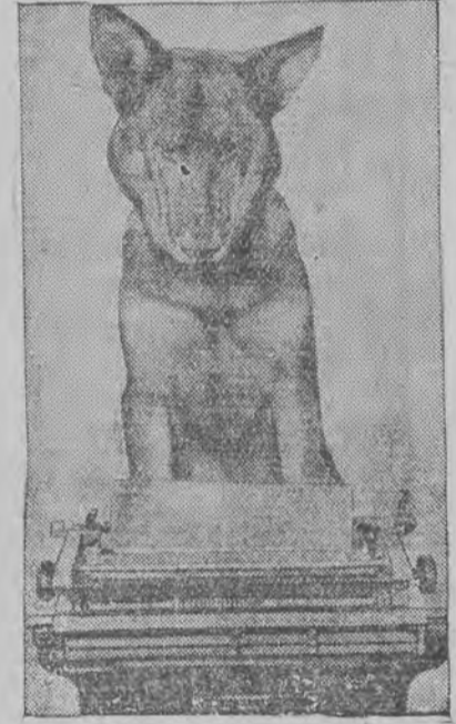
דער בעריהמטער פּילס-הונד רין-טי-טין איז געשטאַרבן אין עלטער פון 14 יאָהר פון עלטער-שוואַכקייט.