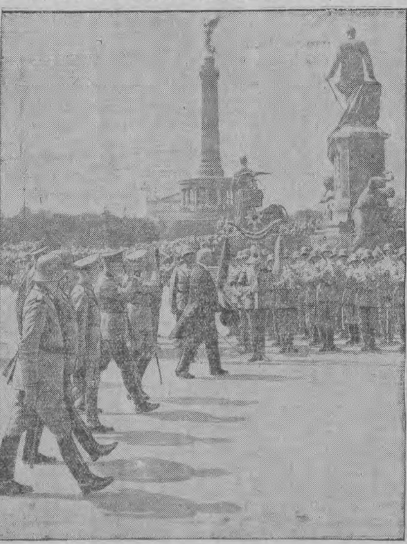
פרעזידענט הינדענבורג נעמט אויף דעם מיליטערישען פּאַרד.