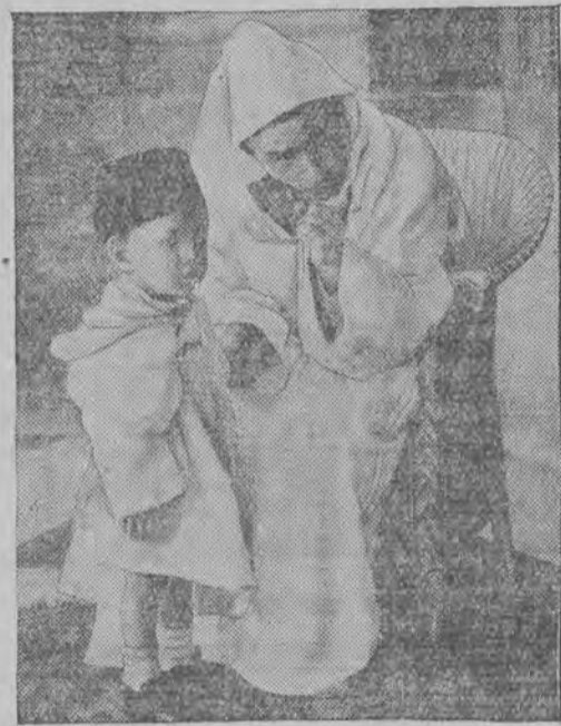
דער סולטאן פון מערקאָ מיט זיין זעהן אויף בעזוך אין פּאַריז.

אַ זון מיט אַ רעגען, אַ שפּיל אינדערהויך, די זון געהט אַרום אין אַ זילבערנעם טייך. די גרינגקייט אויף בויער, איז דורכזיכטיגער אַט געהט שוין דער הימעל אַרום אויף דער פּריי. צולאָטענע העכער און גאַלדענער זאָמה, און די ערד אין אַ בלויער אַ פּרעהליכער ראַהם, און פּרעהליכע פּייגעלעך פליהען אַרום, פּאָל בוים און פון צווישען געזימט פון אַ הויז.