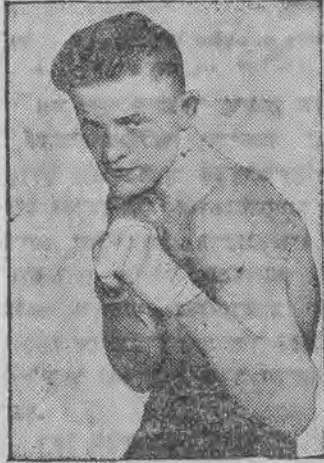
האָבען דערגרייכט די אייראָפּעאישע מייסטערשאפט אין באָקס