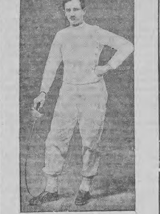
האַט געזיגט אויף דער אָלימפּיאַדע אין פֿעכטען

נאָך דער העלפֿט ווערט „מכבי“ פֿערשטאַרקט מיט פֿאַרענענדיקע מעטשען און פֿערעקלען. אין די ערשטע מינוטען האָט „גוויאָדא“ די איבערמאַכט, אָבער שפּעטער „פֿעזענע“ זיך מכבי אויף דער העלפֿט פֿון די בעסט, די לעצטע צוויי זינדיכט גאַלען פֿאַר „מכבי“ פֿאַלען אין סאַמע סוף פֿון שפּילען דורך סינדערקע און שמיניאָקן.