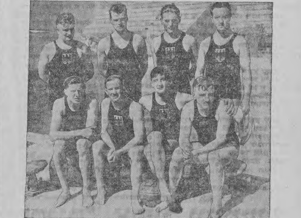
די רייטשע וואָסערבאַל-מאַנשאַפֿט, וועלכע האָט בעזיגט די יאַפּאַנישע אין דער אָלימפּיאַדע

ווידעוו - הכח 0:6 דאָס איז געווען דער לעצטער מייסטער-שאַפֿט-מעטש אין היינטיגען סעזאָן. איידער ס'הייבט זיך אָן די צווייטע-קרייז פֿינאַל-קאַמפֿען, הכח איז צוגעטרעטען צו דעם מעטש מיט אַ שטאַרמבאַרע פֿערנאָכלעטיגונג, ווי בכלל אין די לעצטע מעטשען. „הכח“ איז אַרויסגעטרעטען מיט מעהר ווי אַ העלפט רעזערוו-שפּילער און דעריבער געליטען אזא אונגעוואָונע מלחמה, לאָזענדיג זיך פֿאַנגירען פֿון „ווידעוו“ אין אַ פֿערהעלסטניש פֿון 0:6. דער רעזולטאַט פֿון די היינטיגע מייסטערשאַפֿט-קאַמפֿען איז פֿאַר „הכח“ נישט געווען קיין לויבענסווערטער. די פֿאַרם און דיסציפּלין פֿון דער מאַנשאַפֿט איז געפֿאלען פֿון מעטש צו מעטש און „הכח“ האָט צום סוף פֿערלירען אויך דאָס פּובליקום, וואָס איז שוין צוגעפֿאַריגט געוואָרען צו גרעסערע ספּאָרט-אימפּרעזען.