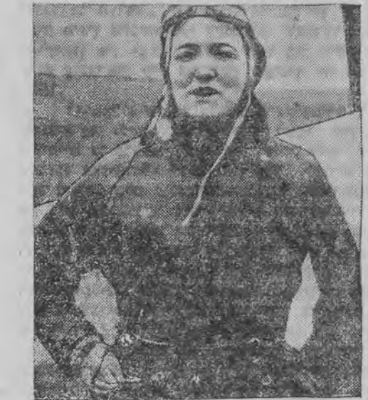
די פֿראַנצויזישע פֿליהערין מאַריז הילף האָט געשלאָגען דעם וועלט-רעקאָרד אין פֿליהען אין דער הויף.

מכבי (לאַדז) - גוויאָדא 2:4 שבת איז אויס'ן פֿלאַך פֿון וו. ק. ס. פֿאַריגט קומען דער מעטש צווישן די וואַרשעווער בעסט און דעם לאַדזער „בע-קלאַסיגען“ מכבי. וועלכער געהט צו צו דעם פֿינאַל פֿון „בע-קלאַס“ דער דאָ-זיבער מעטש איז אונגעוואָרט, הגם פֿערדינט אויס-געפֿאלען לטובת „מכבי“, וועלכע בעזיגט שוין די צווייטע וואַרשעווער „ע-קלאַסיגע מאַנשאַפֿט“.