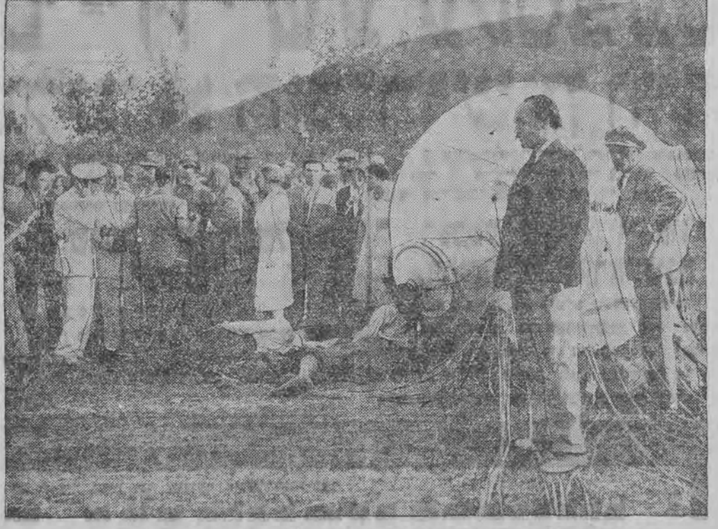
דאס פרעסע בילד, וואס ווייזט ווי פראם, פיקאר לאזט זיך אראפ אויף דער ערד.

ווארשא, 21 (טעלעגראפיש) פון אויגוסט קאר (טעלעגראפיש) אין צוזאמענהאנג מיט דער ידיעה, אז אפי-ציעלע טאקטורען האבען ביהה משפיע צו זיין אויף געוועזענע פאליטישע ארגאניזאציעס אין דער ריכט-רונג פון אפשטעלען די באיקאט-קאמיע לגבי דאנציג - האט די הויפט-פערוואנדלונג פון דעם פער-שאנצ צו שיען די מערב-גרעניצען בעשלעאסען די אקציע צו איבעררייסען. דער פערשאנע האלט, אז די אקציע האט שוין דערגרייכט צו איהר ציל כל זמן דער דאנציג איבער טענאט האט ארויסגעגעבען די פערזיכערונג אז אויפ'ן שטח פון דער פריישטאט דאנציג וועלען גארנטירט ווערען די לעבענס-ויכטיקייט און דאס פערמעגען פון די פאלאקען, און אז עס וועלען פאקאמטיוו.