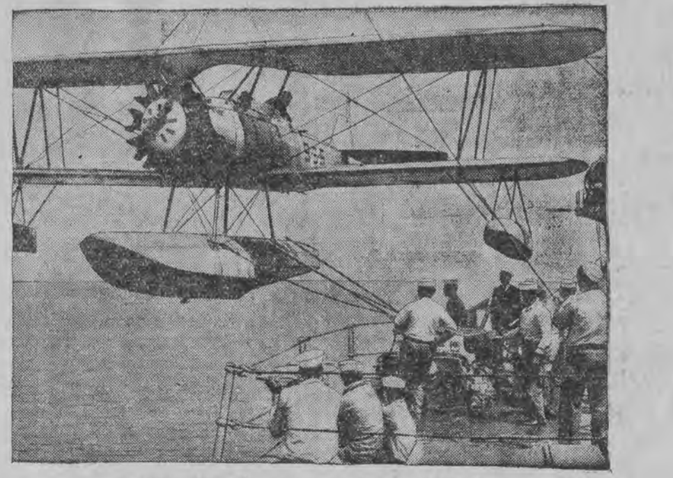
אנאָרפאלאן קעהרס זיך צוריק אויף זיין מוטער-שיף