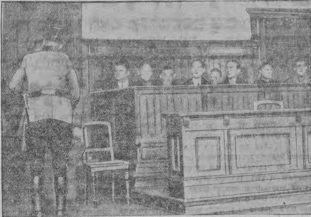
פון וועלכע 5 זענען פער'משפט געווארען צום טויט