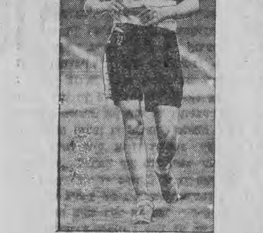
האַט עפּעסנישטעלע 6 נייע ווע. ט. ר. עקוואַרדען