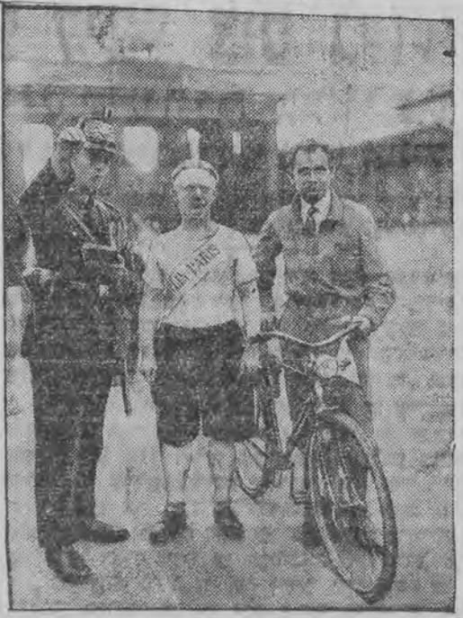
איז מיט אַ קינסטליכען מוס געפּאַהרען אויף אַ ראָווער פֿון בערלין קיין פּאַריז