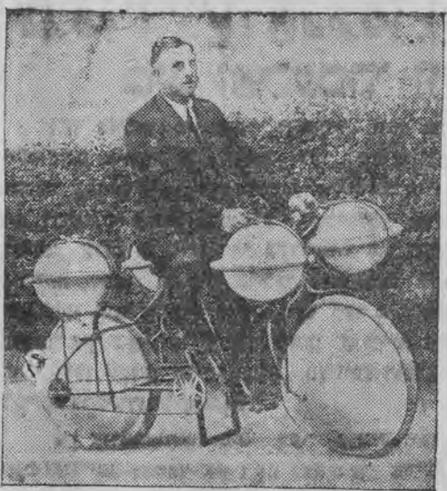
אַ האָווער, וואָס פּאַהאַט אַיפֿן וואַסער און אויף דער יבשה.