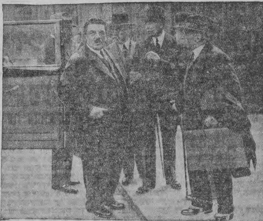
נאך דער ויצונג ווענען דער לעצטער דייטשער נאמע