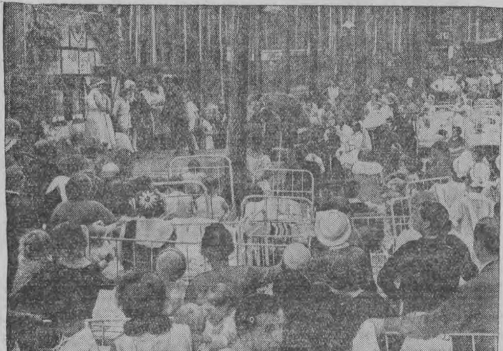
אַ טעאָטער-אַזשעסלונג אין אַ שפּיטאַל פאַר פּערקויפּעלעס קינדער אין בערלין

ביי דער אַרבייט שטעהט אַ שמיד, און ער זינגט אַנאַרבייט-ליד — ווען דאָס איינע און צווייטע, ווי אַ רויטע בלום צובליהט; קלאַפּט ער מיט'ן האַמער דאָן; זינגט דאָס איינע: דלין, דלין-דלין! און דער האַרמער איינע-קלאַנג, מיט זיך אויס מיט זיין געזאַנג, און זיין שטימע, דאָרט זיך אויס, קומט אַנאַיווערנע אַרויס. זינגענדיג, די אַרבייט געהט, און אין לופט אַרום צושפּרייט. פליהען פּיער-פּיערען גיך, גליהען פּינקלעך, לעשען זיך. און אַלץ שטאַרקער קלאַפּט דער שמיד, און אַלץ פעסטער ווערט זיין ליד. אויפ'ן האַרצען איינע הייס, פאַלען גרויסע טראַגענעס שווייס.