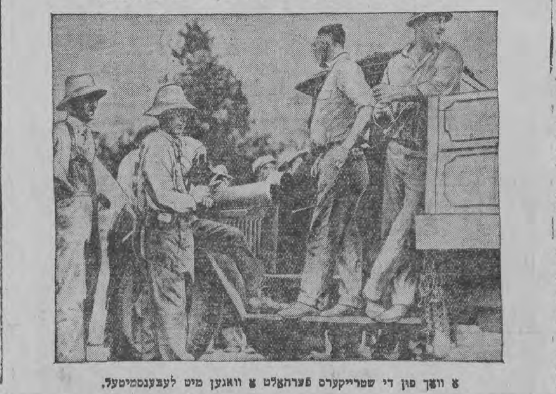
א וואך פון די שטרייקערס פערהאלט א וואגען מיט לעבענסמיטעל.