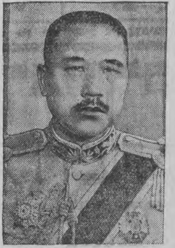
איז ערמארדעט געווארען. דער מערדער איז א זון פון א גענעראל, וועלכען דער ערמאר-דעטער האט דערשעסען.