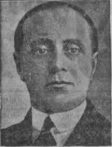
דער הויךקאמיסאר פון פעלקער-בונד פאר דאן ציג מארקין גראווינא אין געשטארבען נאך א שווערער קראנקייט.