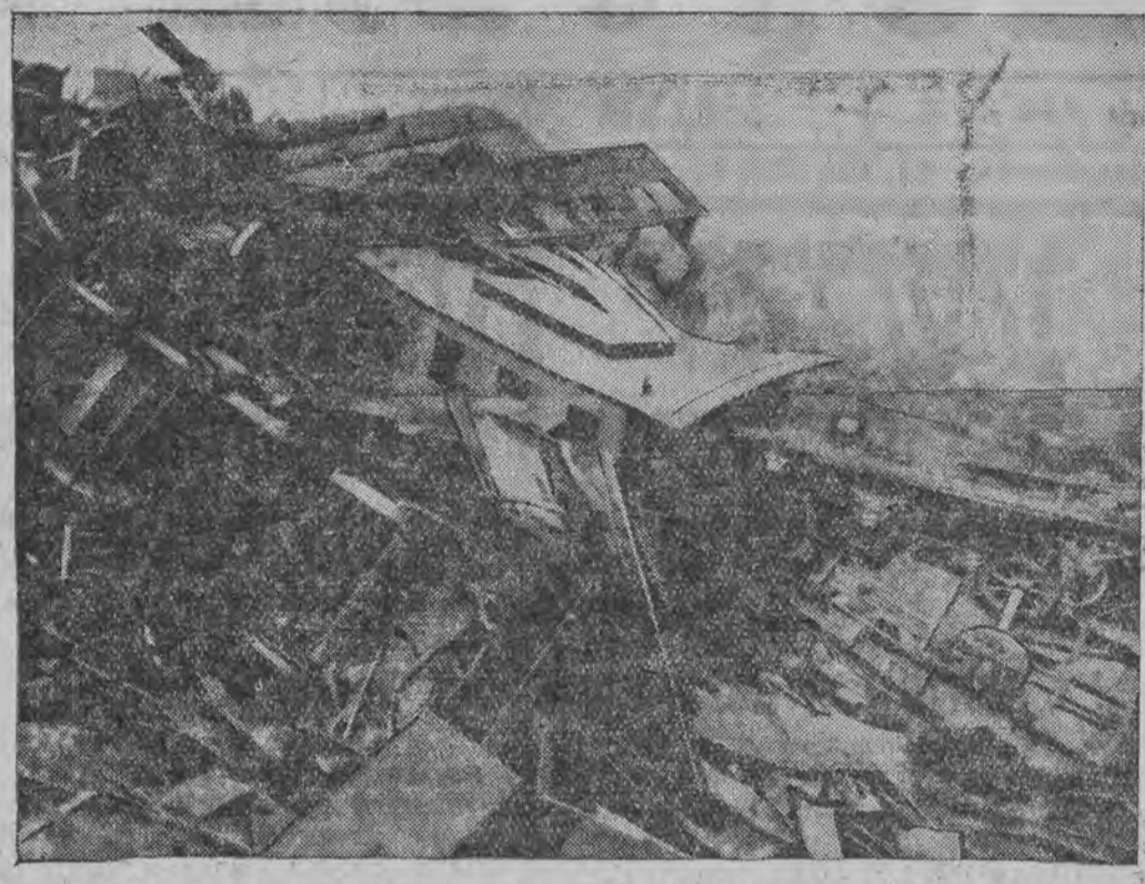
דאס ערשטע בילד פון דער שרעקליכער קאסטראפע מיטן צוג, וואס האט געפיהרט די סאלדאטען פון פרעמדען-לעגיאן אין אלזשיר (אפריקע)

אראן, 20 (ס.ט.ל.) בעז דער גרויסער קאסטראפע מיטן צוג פון דעם פרעמדען-לעגיאן הינטער אראן זענען לויט די לעצטע אויסרע