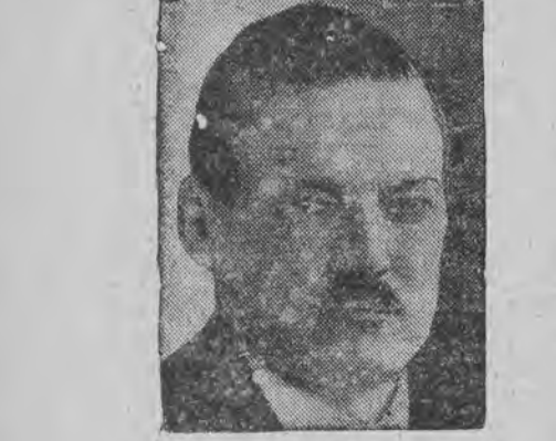
שוועדישען פרעמיער האמירן האט זיך אָנגעפֿען בען אין דימיטיע צוזאמען מיטן גאַנצען קאָבינעט, צוליבן זיג פון די סאציאליסטישען ביי די פאַרלאַגעטע וואַהלען.

שטאקהאלם, 20 (ספ. טעל.) דער אַנטי-פיהר פון די סאציאליסטישע האנגען האט בעקומען די מיטע צו שאַפֿען דעם רעגירונגס-קאָבינעט אין שוועדען.