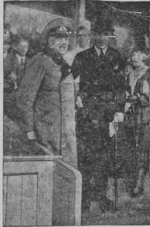
קאנצלער פון פאפען און רייכסוועהר-מיני. שליכער אויף די פערד-געיענען אין בערלין.

גענעף (י.ט.א.) בעת די פיערונג אין לוצערן אין צוזאמענהאנג מיטן יובילעאום פון 600-יאהר-רינקער צוגעהערדיקייט פון לוצערן צו דער שווייץ, וואס דער שווייצארישער פונדעס-פרעזידענט מאַטא אין קלארע און אונצוויידיטיגע ווערטער זיך אַ-רויסגעזאגט וועגען די פרובען איינצופיהרען אין דער שווייץ דעם אַנטיסעמיטיזם. בעצייטענדיג די שווייץ אלס די הויפט-טרענערין פון פרייהייטס-געדאנק אין דער וועלט, האט דער פונדעס-פרע-זידענט מאַטא בעטאָנט, אז אין איהר רייכטען זין בעדייט דעמאקראטיע נישט נאָר ווערט-גלייכ-הייט נאָר אויך ברידערליכקייט. אין שאַרפסטען גענענאָץ צום גייסט פון דער דעמאקראטיע האט ערקלערט דער פונדעס-פרעזידענט, וועלען זיך גע-פענען די יעניגע, וועלכע ווילען גרינגעשעצן זיי.