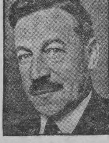
אינערן-מיניסטער הערבערט סעמועל (ליבעראל)

ליקווידירט דעם טעקסטייל-שטרייך איז ענגלאנד