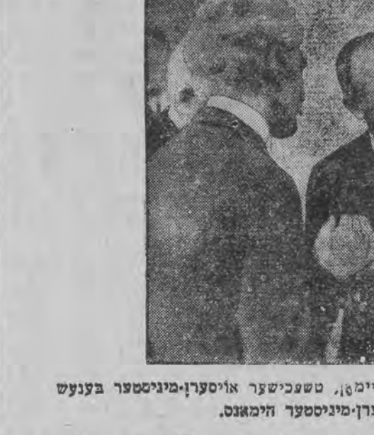
פון לינקס: ענגלישער אויסערן-מיניסטער סימאן, טשעכישער אויסערן-מיניסטער בענעט און בעלגישער אויסערן-מיניסטער הימאנט.