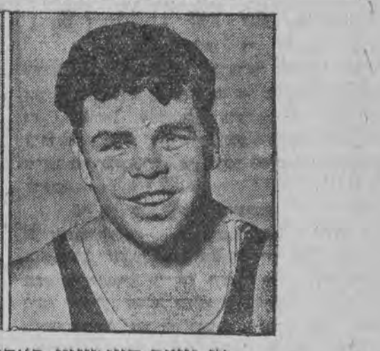
צו זייער היינטיגען באהם-קאמף אין ניו-יארק