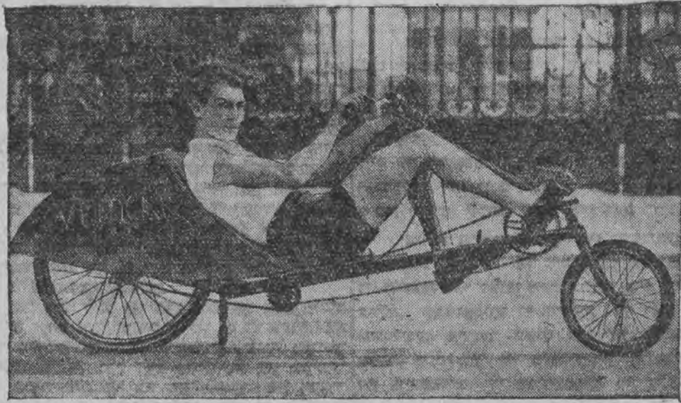
א ראָוער, וואָס ווערט אָנגעטריבען מיט די הענד און פיס, ערפינדונג פון אַ פאַריזער.