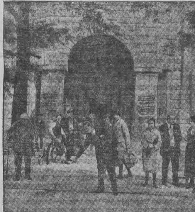
דאס ארט פאר דעם שוואַרצער-באנדיטעז טראנספארט אין בערלין, וואו דער אַנפאַל אין פאַרגעקומען.

אויפן פאַפיר האָט די רעגירונג אָנגענומען אַ פּראָגראַם פון שטאַטס-רעגולירונג איבער דער אינ- דעסטייע, זי האָט אַפילו צום סוף יוני בעשאַפּען עטליכע הונקערדיגע אינסטיטוציעס פאַר אַז דעם צוועק, דאָ אַרומניסטאָווער און טעכנישע פּער- זאַמלונג פון דער אינדוסטריע אין צעזיילט געוואָרען אין פּערשידענע שיכטען, די אויבערשטע שיכטען האָבען מורא געהאַט פאַר די אויסגלייכערדיגע טעג- טענצען פון די אַרבייטער, און האָבען דעריבער געמאַכט די אַחט מיט די קאַפיטאַליסטען, דער אַר- בייט-מיניסטער סקאַפּעלעו האָט אין לאַנגע מאַר- גיפּעטען געהרשט צו די אַרבייטער וועגען דעם, אַז עס אין נישט ראַטזאָם זיי זאָלען זיך מיטען אין דער אַדמיניסטראַציע פון די אַרבייטער, דער וויל, האָבען זיך אַז מיר פאַרביקען אָנגעהויבען צו שליסען, די קאַפיטאַליסטען אַליין אין נמאס געוואָרען אויסצוהאַלטען אַנאַינדוסטריע וואָס האָט געבראַכט מערהר צרות אידען פּראַפּיטען.