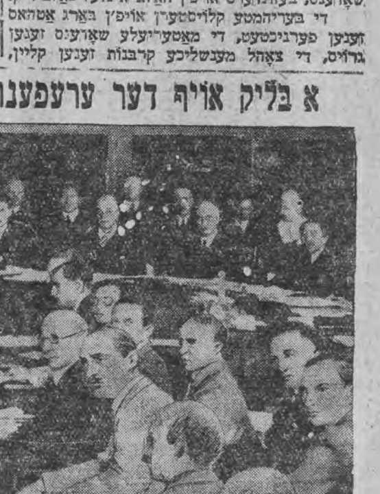
אין הינקעל-פאליטיס, וועלכער איז געוועהלט געווארען אלס פרעזידענט פון פעלקערבונד-פענעם.