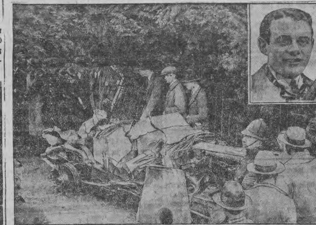
ס'איז אומגעקומען דער בעקאנטער אויטאמאביליסט דענפי (אין ווינקל).