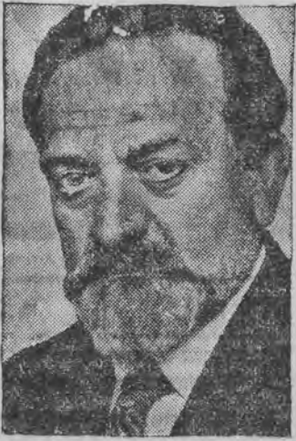
דער בעריהמסער דייטשער מלכער עמיל ארליך איז געשטארבען אין עלטער פון 62 יאהר.

וועלעז זיך בעראשעז אין לאנדאז וועגען די דייטשע בעוואפנונגס-פאדערונגען