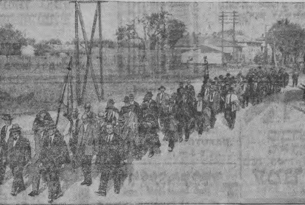
זיי פאדערן מען זאל זיי אויסצאהלען אונטערשטיצונגען