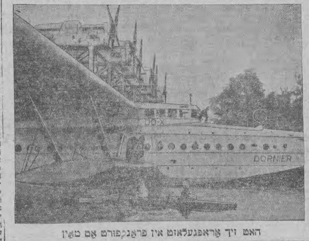
האט זיך אראפגעלאזט אין פראנקפורט אום מאין