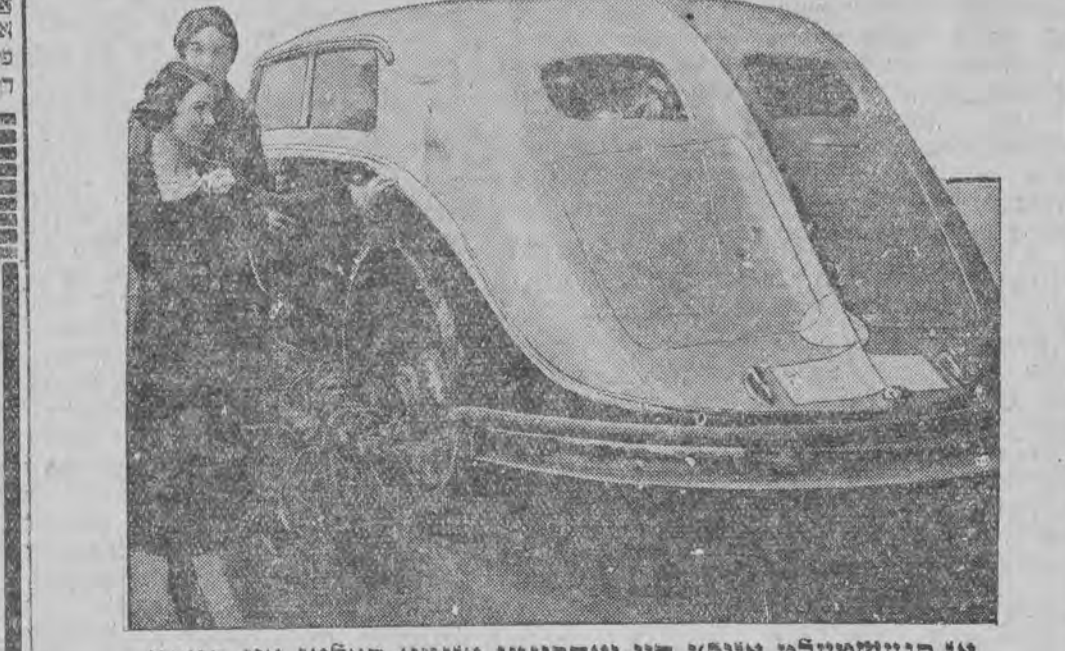
אז סגעשטעלט אויפ'ן היי-יאהריגען אויטא-סאלאן אין פאריז

אין דער יונגער קאַסירערין האָט זיך געליבט אַינט אַ לענגערע צייט דער ווילנער באָהן-בעמאטער פראנצישעק מיקלאשעוויש אַ ווהן פון אַ היגען הויז-אינטעטימער. די שיינע קאַסירערין האָט אָפּען נישט געענט- פערט איהם מיט די זעלבע געפיהלען און-האַט דעם פרייהלב פּרעהאַרשט אַ הייסע ליבע מיט אַ מיליטע- נאַן. מיקלאשעוויש האָט שטאַרק געליטען פון איהר פערנוכט און האָט געוואהט דער קאַסירערין אַן היזעט זיך דאָס פּרעהאַרשט טרויעריג, זי האָט אָפּער אויף זינע וואָונגען נישט געלייגט קיין אַכט אַ געשטויסענער פון בלינדען אויפ'וועכט האָט מיקלאשעוויש בעשלאָסען זיך נאָס צו זיין איבער- דער פּרעהאַרשטער קאַסירערין. דעם פאַטאַלען טאָן איז ער געקומען צו איהר און פּרעהאַרשט אין פּעלד. דאָרט האָט ער זי אויף אַ ברואלען אָפּן פּערגוואַלטיגט און דערנאָך מיט זיין ריזיגער שטאַטען אַוועקגעלייגט איהר אַ טויטע אויפ'ן אָרט. בעגיינדיג דעם מאָרד איז מיקלאשעוויש אַנטלאָפּען. נישט געקוקט אויף דעם, וואָס די פּאָליציי האַט אָנגעווענדעט אַלע מיטלען צו פּרעהאַלעטען דעם מערדער אין מיקלאשעווישען געלונגען זיך אויסצובעהאַלעטען.