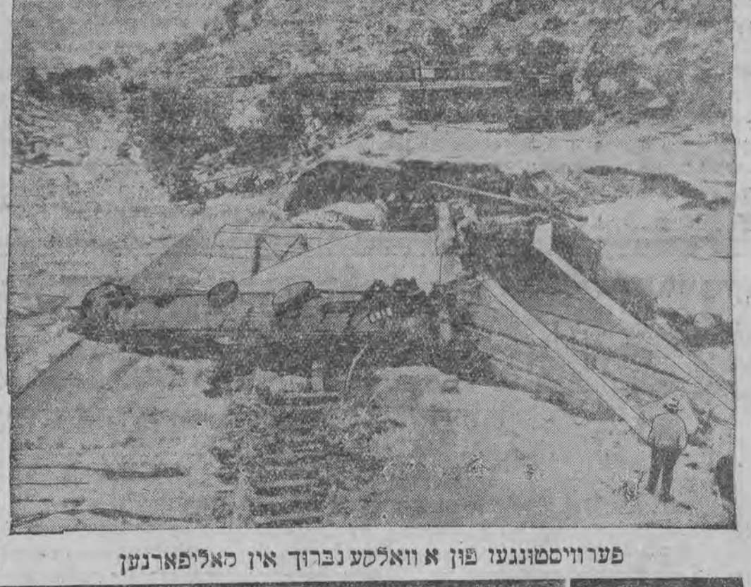
פער וויסטונגען פון א וואלכע נברוך אין האליפארנען

די אנטלויפענע חנה פעסליאק פאדערט פאר זיך צוויי-דעקט. אז ירושלים. (ט"א) דבר' טיילט מיט, אז אין די רעגירונג-קרייזען ווערט דיסקוטירט דער פלאן ווענען אויסבויען אויך אין יפו א גרויסען פארט לויט'ן מוסטער פון חיפה. לויט דעם פרא-וויזאישען פלאן זאל דער יפו'ער פארט זיין אויס-געבויט צו אנהויב 1937. לויט סטאטיסטישע דאטען זענען אין חיפה אין צוואנציגסטן מיט'ן פארט-בוי, ענטשטאנען נייע בנינים אויף דער אלגעמיינער סומע פון אג' ערך א פירטע מיליאן מונט. א העלפט פון די נייע בנינים זענען אויסגעבויט געווארען לורך יודען, הגם יודען בעטרעפען איצט בלויז א דרי-טעל פון דער אלגעמיינער בעפעלקערונג אין חיפה.