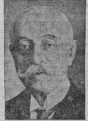
אלס נאכפאלגער פון זאמיס'ן ווערט אנגערופען אדמיראל קאנדראיאטיס.