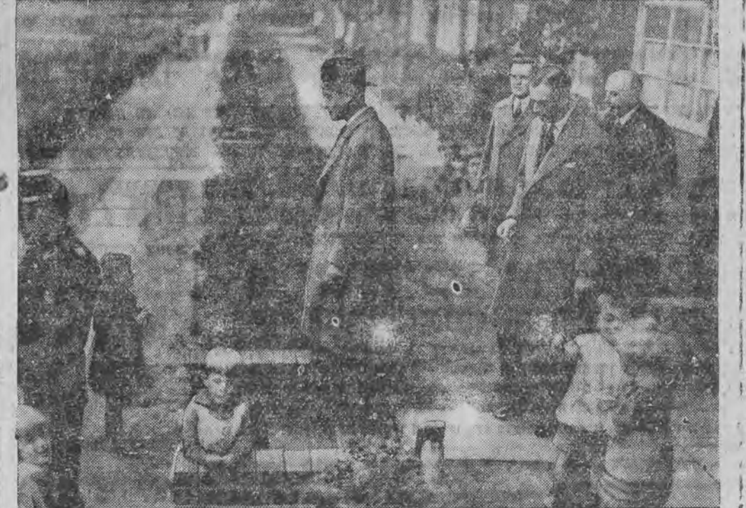
אויף בעזוך אין די האמבורגער ארבייטער-קאלאניעס