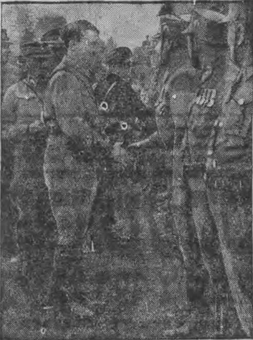
היטלער בנגריס זיינע אפטיילונגען אין קאבורג וואו היטלער איז איינגעלאדען געווארען צו דער פערלאנגונג פון פרינצעס סטיוולע מיט פרינץ גוסטאו אדאלף פון שוועדען.