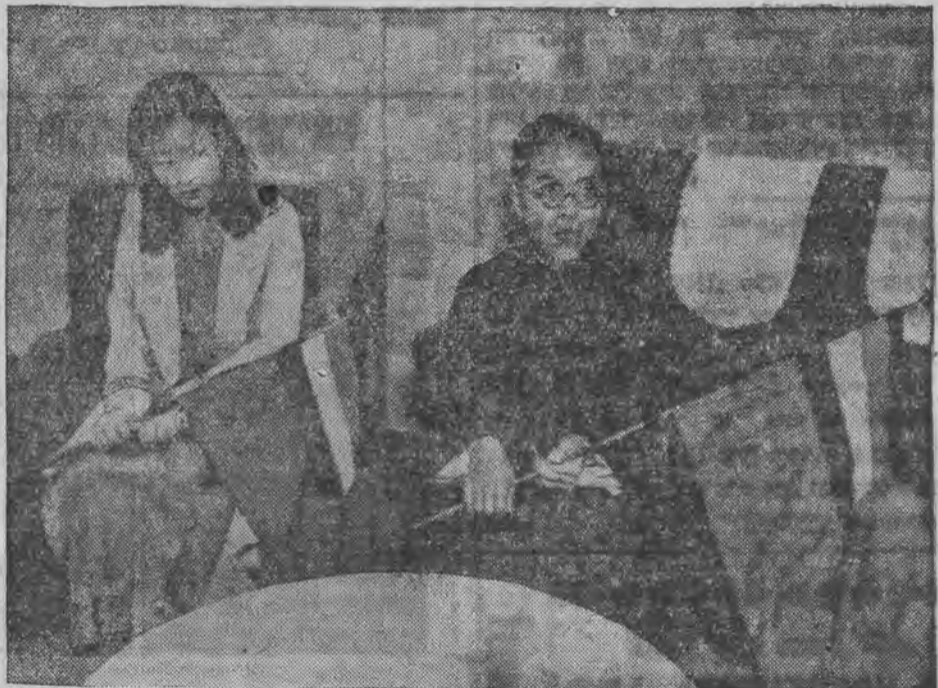
דער ערשטער געזונדער פון דער נייער מלוכה אין וויסען מוח פאנושווקא. דער געזונדער איז געשיקט געווארען נאטירליך קיין יאפאן.

„ווייל יודען האלטען, אז דער אויפבו פון דער יודישער נאציאנאלער היים אין ארץ-ישראל איז א ריין-יודישער ענין, דאס איז אפער נישט ריכטיג, עס איז פאקטיש אן-ענגלישע פראגע.“ ענגלאנד האט, דורך דער בא-למור-דע-קלאראציע, זיך פאר-פליכטעט אויסצובויען די יודישע נאציאנאלע היים, אויך פערזענליך, האט ערקלערט לאָרד רידינג, בין איבערצייגט, אז די ענגלישע רעגירונג, נישט קו-קענדיג פון וועלכער פארטיי זי בעשטעהט, וועט אויספיהרען די פערפליכטונגען, וואס די בא-למור-דע-קלאראציע האט אויף איהר ארויפגעלעגט.“ רעדענדיג וועגען זיינע איינדרוקען פון זיין לעצטען בעזוך אין ארץ-ישראל, האט לאָרד רידינג אויסגעדרוקט זיין בעוואונדערונג פאר די דארטיגע יודישע דערגרייכונגען. ארץ-ישראל איז איצט נעמעט דאס איינציגע לאנד, וואס האט פערהעלט-נישמעטיג ווענג געליטען פון דעם עקאנאמישען וועלט-קריזיס. ער האלט אויך, אז די קאפיטאלען, וואס די יודען פון פערשידענע לענדער אינוועס-טירען אין ארץ, ברענגען גוטע רעזולטאטען. אויך דער פראגע, וואס פאר א ווירקונג א מעגליכע היטלער-רעגירונג אין דייטשלאנד קען האבען אויף דעם פרידען אין איראק, און בע-זונדערס אויף דער לעגע פון די יודען אין דייטש-לאנד, האט לאָרד רידינג געזאגט: „מיר וועלען בעהאנדלען די דאזיגע פראגען, ווען זיי וועלען ענטשטעהען. צו וואס רעדען וועגען זיי איצט“ לאָרד רידינג, וועלכער איז אַמאל געווען