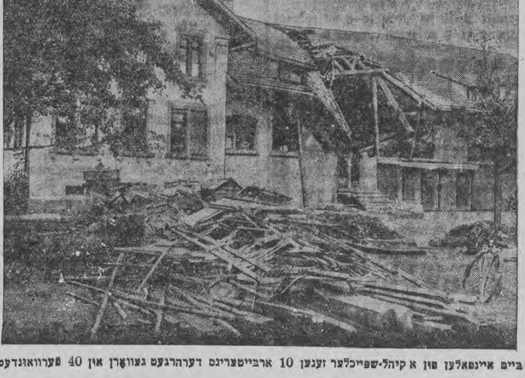
ביים איינפאלען פון א קיהל-שפיכלער זענען 10 ארבייטער איינגעקלאמערט געווארן און 40 פערוואונדעט