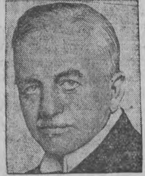
גרונדער פון טראַפיש-היגיינעסען אינסטיטוט אין האַמבורג, איז אלט געוואָרען 75 יאָהר.