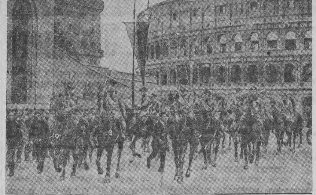
צום 10-טען יאהרטאג פון פאסיסטישען זיג. מוסאליני רייט אין אינדערמיט פון פארענט.

בידנאשטש, 1 (י.ט.א.) טעלעפאניש. פון טשעוו טיילט מען מיט, אז אין רעוולוטא פון דער לעצטער אנטיסעמיטישער העצע פון די ענדעקעס, זענען נעכטען אלע שויפענטען פון די יודישע געשעפטען אויסגעהאקט געווארען. די פאָ-ליציי פיהרט אַנאָאָספּאַרשונג.