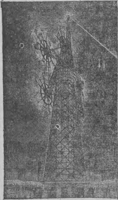
דער דייטשער אינושניידער האָנעף בויט אַ ריזיגע ווינד-קרופט-טורם פאַר דער וועלט-אויסשטעלונג אין טשיקאָגאָ.

ווי פאטאצקי און זארעמבא זענען געקומען צום יודענטום? - די נסיעה אין רוים און אמסטער- דאם. - זארעמבא האט חתונה און פאהרט אוועק זיך מגייר ווין. - ער פאהרט קיין ארץ- ישראל. - פאטאצקי לערנט מאן און נאכט איז איליער בית-מדרש. - א שניידער מסרס פא- טאצקיין פאר דער רעגירונג. - מען וויל איהם איינערדען, ער זאל. תשובה טון. - מיין בעגענעניש מיט אנאייניקעל פון דעם שניידער. - דער שניידער מסור איז געשאדען מיט א שרעקליכן מיט