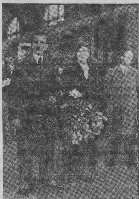
דער נייער שווייצארישער געזאנדטער דיניכערט אין בערלין