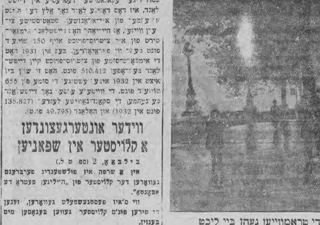
צוליב'ן גרויסען נעפעל טוזען די טראמוויען געהן ביי ליכט

ווארשא, 2 (טעל.) די מארגענדיגע ערשטע זיצונג פון סיים אין די אינפלאציע פארלאמענט-סעסיע וועט זיך אנהויבען 10 אינדערמיינען.