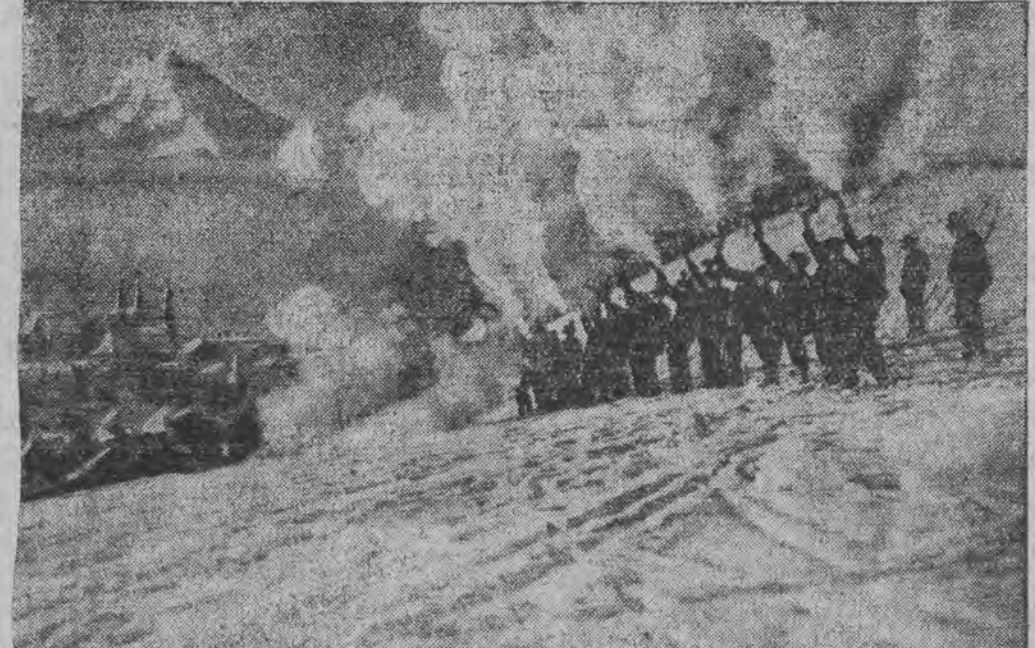
אין די בייערישע בערג ווערט געהאלטען א מוהו, אז אין מאָרגען פון נייעס יאָר ווערט אָפּגעגעבן א וואָפּ אין די בערג לכבוד דעם יאָר.