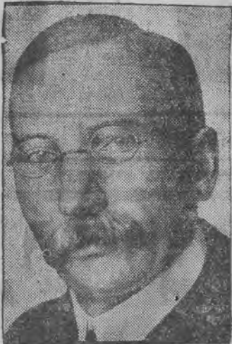
גענעראל הערצאג, פרעמיער פון דרום-אפריקא שצן בונד, האט מיטגעטיילט, אָ דער בונד זאָגט זיך אָפּ פון גאלד-פארטעט.