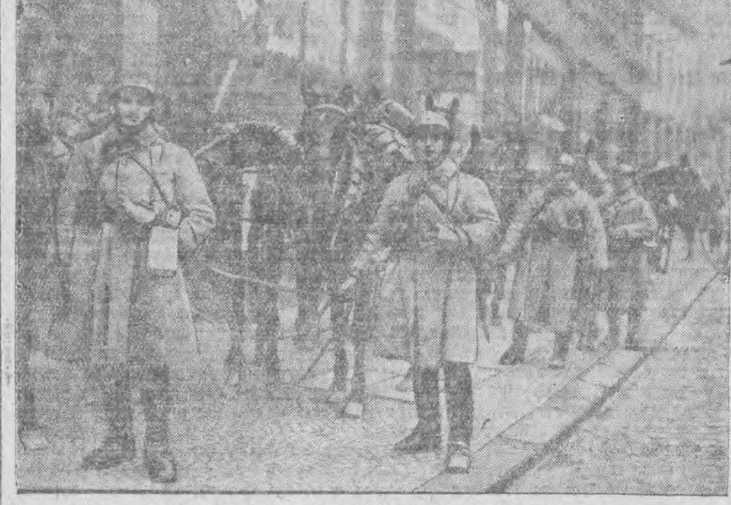
אַ קאָפּאָציע פֿון וואַר-געפינט דורך פּאַנצויזען און בעלינער מיט 10 יאָהר צוריק

געוואָרען געוואָרען. עס איז אַ קליין־אינזעל און קיינער וואוינט אויף איהם גישט מענטשן קענען זיך דאַרטען גישט אויפּאַלען ווייל עס איז דאַרטען קיין יאָר סעך גישטאָ. דער אינזעל, וועלכער איז אַרונטער־ גילט מיט וואַסער פֿון אַלע זייטען, האט קיין טראָץ פֿון וואַסער, גישט צום פּרינצען. עס זענען דאַרטען אויף גישט קיין פּוילגען קוסטעס, כאַטש גע- ווען גראַזען האָבען זיך יאָ פּונאַווערענעשפּאַרט אויף דער שטיינערדיגער ערד, ווי אַזוי די גראַזען זענען געקומען אויף דעם אינזעל איז אַן און פֿאַר זיך איינשטערקענט. מען גלייבט, אַז דער ווינט אָר- דער פּינגלען האָבען אַרייפּערגעלאָזען די זיימען פֿון אַלאַסקאַ אָדער סיביר און אַזוי אַרױס האָבען זיי געוואָרען געוואָרען אויף דעם איינצען אינזעל. עס איז שווער צוזוקומען צו דעם פּלאַץ. אָר- בער דער בעוואוסטער אמעריקאַנישער נאַטור־פֿאָר- שער, דער קאַמיליטערי גלח פּעריאַרד האַבאַרד, האט איהם יאָ בעוועט. ער האט געפּינגען ווי ער איז צוגעקומען צו דעם פּלאַץ און וואָס ער האט דאָר זען געווענען.