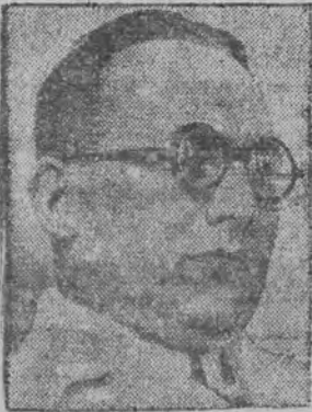
האט בעווירן די אפערירן און די פערזענלעכע אפערירן הארץ

עס האבען זיך וועגען א פאל פון שלעכטן זין לען דער פון אירען-באטן. דער מיניסטער שטעלט זיך אויף לענגער אפ אויף די טעראר-אקטען וואס ווערן ארויסגעפירט געווארען געגען יודען מוז די ענדעקעס און אויף די מיטלען וואס די רעגירונג האט אגענומען צו אונטערזייען די אנטקעמלישע טעראר-אקטען. די מלוכה — וואס דער מיניסטער — מוז און האט דאס רעכט צו שיצען אלע פירנער און איר טעראר-אקטען סיי די ענדעקישע אנטקעמלישע אונטערזייען און סיי די פירער-אונטערזייען ווערן גלייך צעריגט אונטערזייען געווארען. וואס שייך די אנט-יודישע עקסצעסן, האלט דער מיניסטער, אז די יודישע פירעס עהאט א סך און דער הינזיכט איבערזייען.