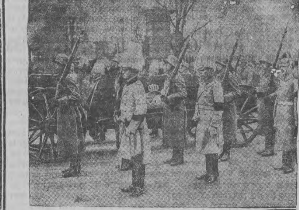
לייח פון פערשטארבענעם פרייז אלפאנס פון בייערן

האָט גארניקעל געזעען אַז ציה מיט די אַקסלען און האָט געמאכט אַזאַ בעמערקונג: