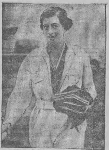
די בעקאנטע ענגלישע לופט-פליהערין מיס ספונעף איז געשטארבען אין עלטער פון 32 יאהר.

אן שארף דעם עקס-כעדיען, און ער האט בעקומען כולמרשט פון גוט אינפארמירטע קוועלען א מעל-דונג, דאס דער עקס-כעדיען האט קאנפערירט מיט דער יודישער אגענץ וועגען דעם אופן צו לעזען דאס יודישע פארבאפע און א"י. די יודישע אגענץ זאל איהם האבען פארגעלעגט איהר הילף ביים עראר-בעיען דעם קעניגליכען טראן און א"י אונטערן ענגלישען מאנאט און האט געשטעלט פאלגענדע בעדינגונגען: (1) די אגענציע וועט פון אלע יודישע רעכט, וואס זענען גאר אונטערט אין דער פאלסור-דעקלאראציע און אין מאנאט. (2) איבערזידלונג פון די ערדלאזע אפבאס פון א"י קיין עבר-הירדן, כדי די צעהל אראפער און א"י זאל קלענער ווערן. (3) ערליבען אויף א יודישע מאסן-עמיגראציע קיין א"י אין הסכם מיט די פלענער, וואס זענען אויסגעארבייט געווארען דורך דער יודישער אגענץ. (4) אין די מלוכה-אמטען דארטען זיין בעשעפטיגט יודען