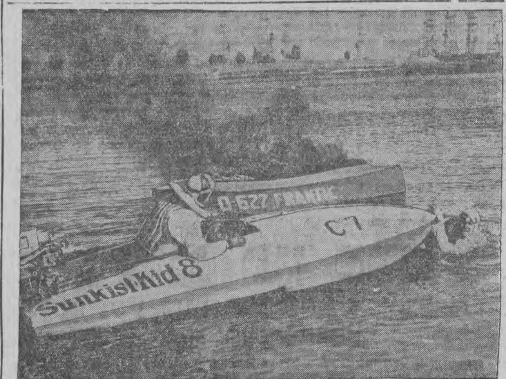
בעת א געניג פון מאַטאַר-שיפלעך אין קאַליפּאָרניען האָט זיך איין אינמיטען אָהרען אָנגעצונדען, די צענקערין האָט בעוויווטן ארױסצושפּרינגען פון מײַער.