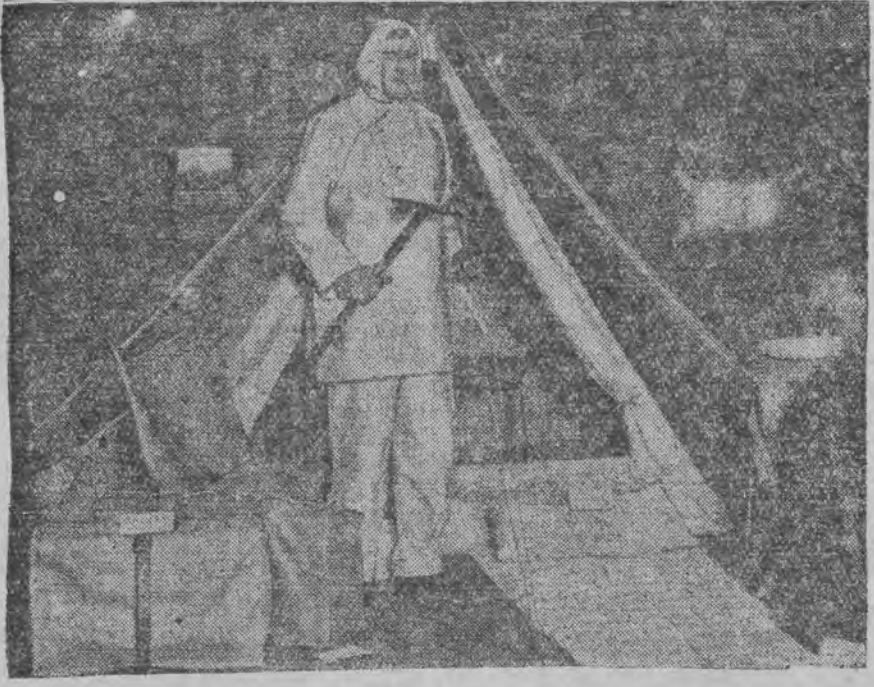
אמ אזוי וועט זיין אויסגעריכטעט די נייע ענגלישע עסספעריציע צו די הימלאיא-בערג אין אויען

און דא איז געשעהן א זאך, וואס האט ארייס געדעפן גרויס אינטערעס: עס האט זיך אין אדעס צוגעהויבען א שטארקע בעוועגונג פאר קאמאנדאנט מענטשן און פערזענליכע ערליי קרייזען און ייטענדיג צען האבען געארבייט זען ענדעריש און געזען אלץ וואס ס'איז נאך געווען מעגליך, אז מ'זאל קאמאנדאנטן בענגעדיגען, אז מ'זאל איהם שטימען דאס לעבען, און דאס מעקורירדיגסטע דערביי איז געווען וואס ער נישט פאר אלעמען האט אין דעם געארבייט די ווייב פון דעם בעוואוסטער גענעראל שטערנבערג, די צייטגעווענע דאזע, ווען ער האט געהאט א גרויסען איינפלוס אין די "הויכע פער-סטער", האט זיך שטארק פערזאנליכער און קאמאנדאנט און די האט געטון אלץ וואס ס'איז נאך געווען מעגליך איהם צו ראטעווען. זי האט געזעלט אן מ'זאל אפאלענען דעם טאג פון דער היינטיגער וואו זי האט געזעלט אז מ'זאל קאמאנדאנטן ברענגן צו איהר אהיים, ווייל זי וויל איהם פארשטעלען פאר איהרע געסט. (וויסער מאגאזין)