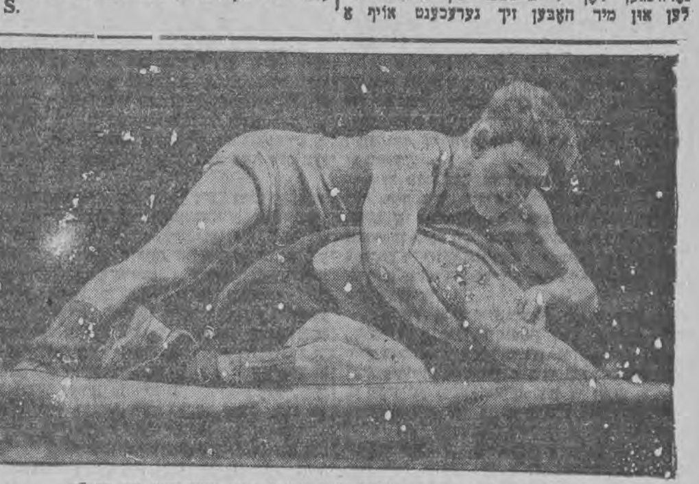
אינטערנאציאנאלער אמאטארען-רינג-קאמף-טורניר קומט איצט פאר אין בערלין

אין שייכות מיט דער רעארגאניזאציע וואס ווערט אדורכגעפיהרט אין דער ארבייטער-ספארט-גע-זעלשאפט „פארויס" קומט פאר פרייטאג אנטפלע-מייע פערזאמלונג.