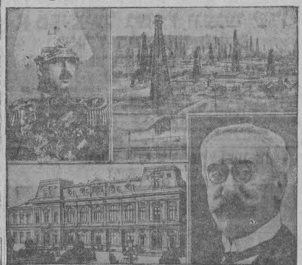
אויבען: רעכטס: די נאפט-קוואלען ביי מארעני. לינקס: קעניג קאראל פון רומעניען. אונטען: רעכטס: דער פרעמיער ווערז וואיוואד. לינקס: שלאס פון קעניג אין ביקארעשט

זאקאפאנע איז היינט איין גרויס וואסער, עס איז נישט פערטאן קיין שניי און קיין אייז. אלע פערמעסטונגען וואס האבען היינט געוואלט פארקרימען האבען געמוזט אפגערופען ווערען, אלע עקס-פעריציעס קלויבען זיך שוין צווייטערהערען, אויך אלע טוריסטען האבען היינט אין אונזער פערלאזען זאקאפאנע. דאס שלעכטע וועטער האט צושטערט די גראנד-יערקייט פון דער אימפרעזיע.