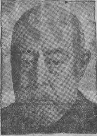
דער בעקאנטער היסטארישער באקער קארל פירסטער בערג (א יוד) איז געשטארבען אין עלטער פון 88 יאהר. פירסטערבערג איז געווען איינער פון די פאפולערסטע מענשען אין דייטשלאנד.