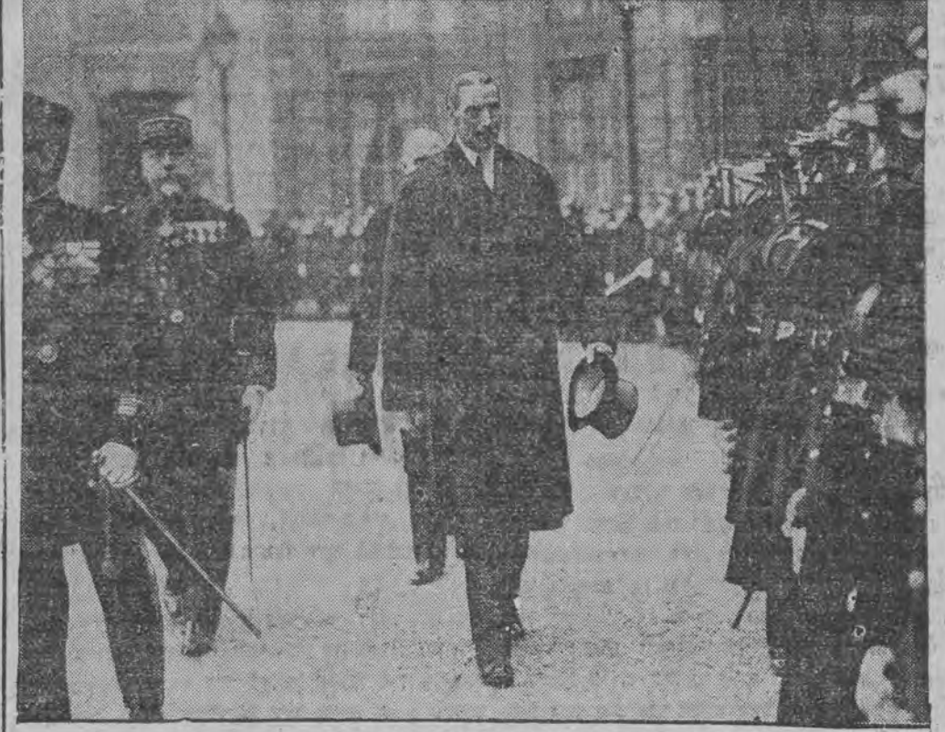
פאר'ן פראנט פון דער עהרען-קאמפאניע אין פארין

וואס שיינט אן 22 (ספ. טעל.) א גרויסע אויפדערונג איז געווען אמעריקא האט אויסגעווען די יריעה וועגן א נייעם פרויב פון אנאמבענטאט אים'ן פרעזידענט רוועלע. אין צוזאמענהאנג דערמיט, וואס פרעזידענט רוועלע דארף איבערנעמען זיין אמת, בעקומט ער פון נאנץ אמעריקא הונדערטער פעקלעך מיט פערשידענע מתנות, צווישען די דאזיגע מתנות האט זיך אויך געפינען א באמבע. די בעמטע אויף דער פאסט, וועלכע גיבען אכטונג אויף די אנגעקומענע פעקלעך, איז ארייט- געקומען פערדעכטיג און ביי דער גרעסטער פאר- זיכטיגקייט האט מען עס געפענט און געפונען דארט א באמבע. זי איז געווען אויף פריפארט, אז זי האט געדארפט אויפרייסען דעמאלט, ווען מ'וואלט געפענט דאס דעקעל פון דעם קעסטעל. אין וועלכע די באמבע איז געווען איינגעפאקט, מיט א מ, 22 (ספ. טעל.)