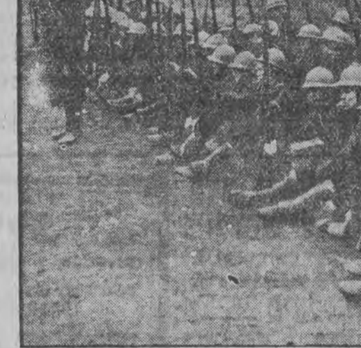
מיליטער-אפטיילונגען פון דער ארמעע, וואָס געהט אויף דושעבאַל.