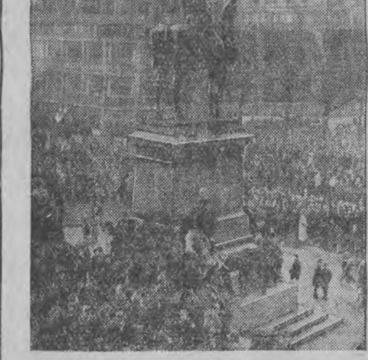
אין רעפּובליקאַנישען דייטשלאַנד זעהט מען נישט קיין אַנדערע פּאַהן. ווי די מאַנאַרכיסטישע שוואַרץ־ווייס־רויט אין דעם האַקענקרייט

וויען, 8 (פ.ט.ט.) בען אַ פֿעראָרענונג אין וועלכער סײַנען פֿערייַכטע פֿערוואַנדעטען און דעמאָנסטראַציעס.