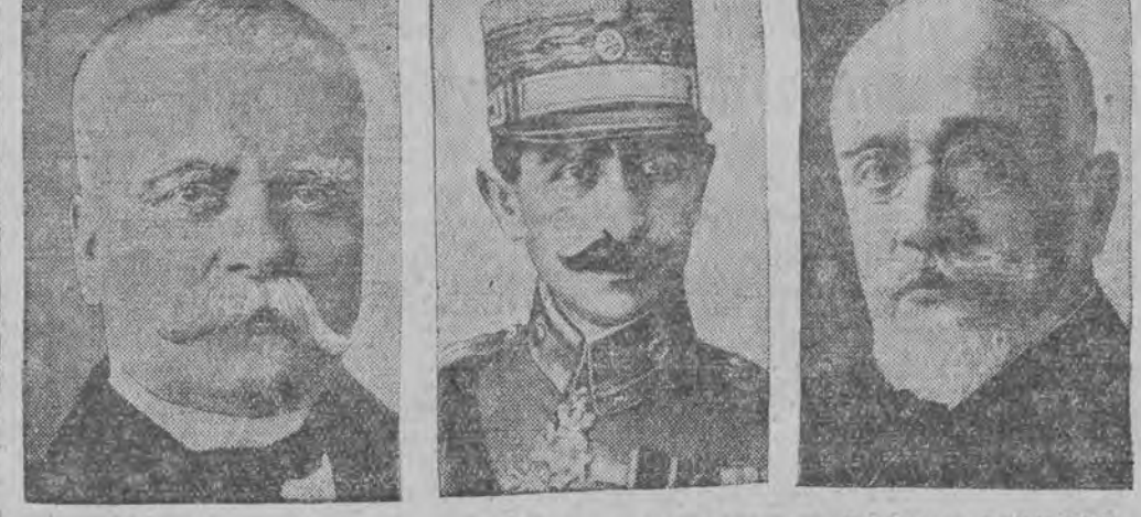
פּרעמיער וועניואַלאַס איז אַראָפּ אין דימיטע זאַל בילדען די נייע רעגירונג דער דימיטאָניאָפּער פּרעזידענט זאימיס גענעראַל אַטאַנעאַם