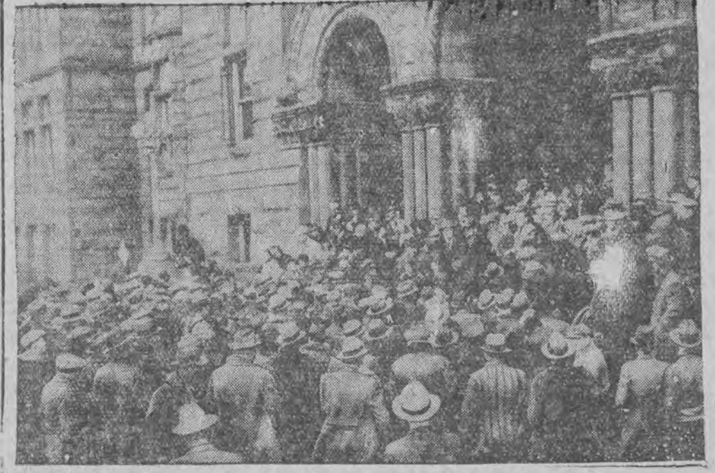
שטורם אויף שפאר-קאסע אין איינגל פון די אמעריקאנישע שטעט

וואַרשא, 8 (טעלעגראַפֿיש) פון אַווענד קאָר-רעספּאַנדענט) נעכטען אַיבנדרפרייה האָט די באַהן מאַכט פּעסעגערסטעלע אויף דער באַהן-ליניע הינטער-לאַדז-קאַלישער, אַז אויף די שינעס זענען אַרױס-געשריבט געוואָרען 13 שרױפֿען און אַרױסגעשריבט געוואָרען 2 שינען-בינדרערס.