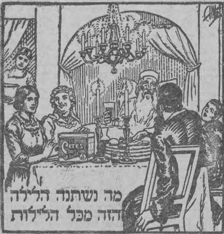
מה נשתנה הלילה הזה מכל הלילות