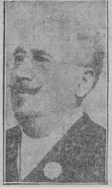
אברהם גאלדפאדען דער גרינדער פון יודישען טעאטער. עס ווערט איצט 25 יאהר ווי גאלדפאדען איז געשטארבען אין ניו יארק.

אברהם גאלדפאדען געהערט צו די גרעסטע קינסטלער, וועמענס היסטארישע פערזענלעכע ווערן שוין פסטעטעטעלט געווארן נאך דאן ווען זיין גאנצע קלינגט ביט בלויז ווי א לעגענדע. נאר ווען עס לעבען נאך אנדערע מאמענטן און טעאטער וועלע האבען איהם אלץ געהערט אהער געזעהן, אפילו די מארקסיסטישע קריטיק אין ראטערפערבאנד, וועלען אזו גלויבן שטארק צו די שרייבער וועלען לעבען ביט ארער האפען ביט געלעבט און איהר רע די אמות, אפילו זי איז גענוג לייטעליג צו גאלדפאדען פאר דער אידישער קענסטלער ווען אומגעווענליכער פערזענלעכער פאר דער גרינדונג און ענטווארפונג פון דער יודישער ביהנע.